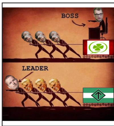
Kuva 3. Viikon meemit #1 (24.8.2018)