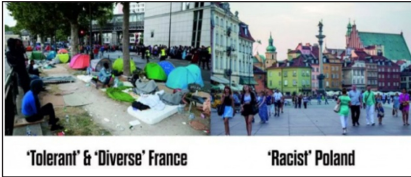
Kuva 7. Viikon meemit #2 (31.8.2018)