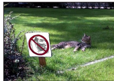
Kuva 1. Viikon meemit #3 (7.9.2019)

Meemin kissa-aihetta voi tulkita fasismiin liittyvän eläin- ja luonnonsuojelun, niin sanotun ekofasismien kannalta,