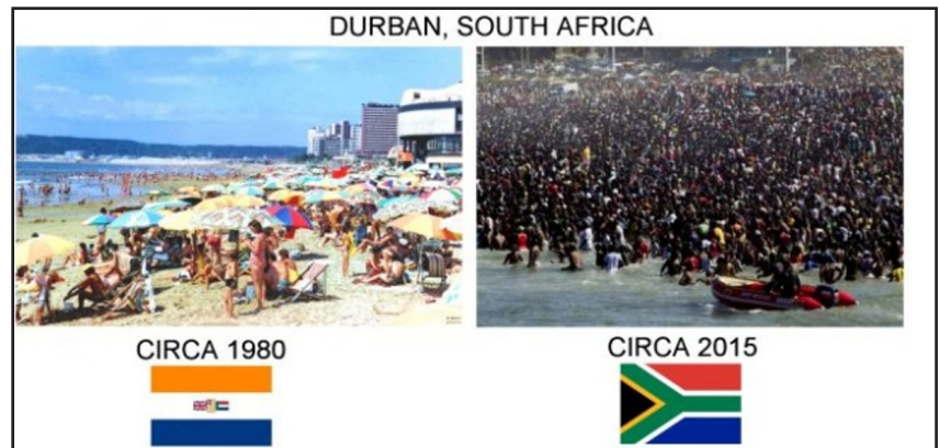
Kuva 2. Viikon meemit #9 Africa Edition (20.10.2018)

Fasismien estetiikan ja visuaalisen retoriikan kannalta kuvien välinen kontrasti rakentaa niille ja koko meemille merkityksen. Vasemmanpuoleisessa kuvassa vallitsee järjestys ja harmonia. Värimaailma luo kirkkaan ja valoisan vaikutelman. Taivaalle on jätetty tilaa ja rantaviiva leikkaa kuvan kauniisti kahteen osioon, katse kiinnittyy edessä olevaan valkoihaiseen naiseen ja lapseen. Oikeanpuoleinen kuva on värimaailmaltaan tumma ja sen tapahtumat vaikuttavat kaoottisilta ja vaikeasti hallittavilta. Yksilöitä ei erotu, vaan kuvasta vyöryy