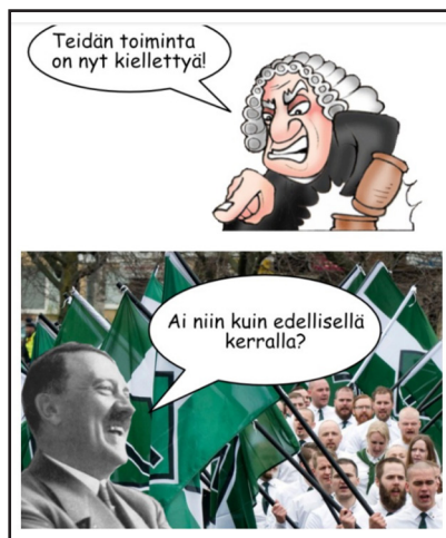
Kuva 5. Viikon meemit #6 Kielto-edition (28.9.2018)

Visuaalisen estetiikan näkökulmas-ta meemi hyödyntää useita fasisiselle estetiikalle tyypillisiä välineitä. Hitlerin kuvalla itsellään on huomattavaa sym-bolista arvoa fasismiin estetiikassa (esim. Sontag 1974). Meemikulttuuris-sa Hitlerillä on kahtalainen rooli: toi-saalta hänen kuviaan käytetään äärim-mäisen pahan symbolina ja natsien/