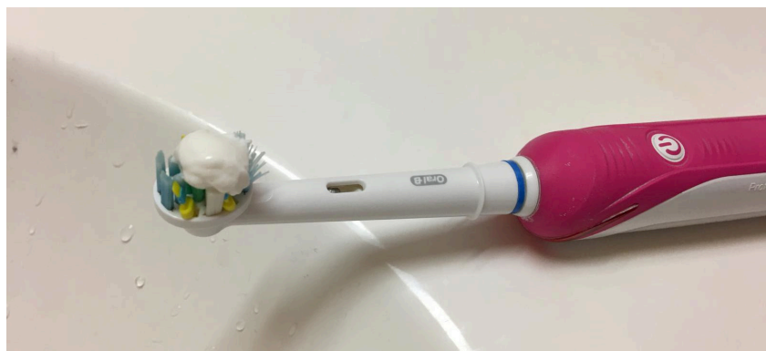
Kinky voi näyttäytyä hyvin arkisinakin tekoina. Yhteisesti sovittu valtasuhde voi näkyä vaikkapa siinä, että alistuva osapuoli pursottaa valtaa käyttävälle hammastahnan valmiiksi harjaan.

Jotkut toteuttavat myös kokoaikaisista kinkyä valtasuhdetta, jossa henkilöt ovat yhdessä sopineet elävänsä jatkuvassa valtasuhteessa, jossa sovittujen sääntöjen puitteissa toinen määrää ja toinen alistuu. Vaikka tämä kuulostaa ehkä äärimmäiseltä olemisen tavalta, voi tällainen valtasuhde näkyä hyvin arkisissa asioissa. Sopimus voi vaikkapa olla, että alistuva osapuoli pursottaa toiselle iltaisin tahnan hammasharjaan. Tavalisistakin arkisista asioista voi näin tulla osa kinkyyttä, kun yhdessä sovitaan sen olevan sitä. Tällainen kokoaikainen valtasuhde ei kuitenkaan ollut tutkimuksen aineistossa merkittävässä roolissa, eikä kaiketi muutenkaan yleisin tapa