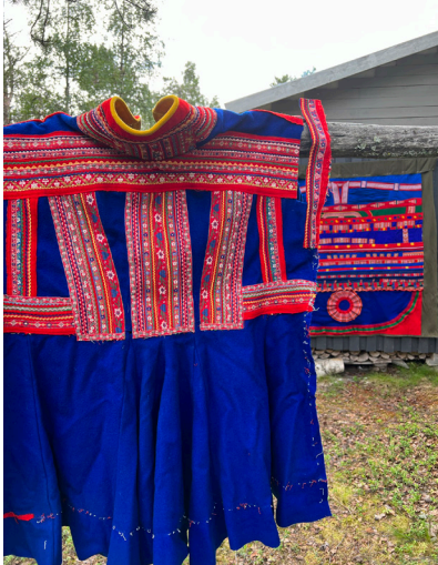
Kuva 9. Perinne uudessa muodossa.

hahmottaa duodjiin kuuluvan ajattelutavan ja arvomaailman. Käytännön duodjiosaaminen on olennainen osa taiteellista duodjitutkimusta ja produktion toteuttamista.