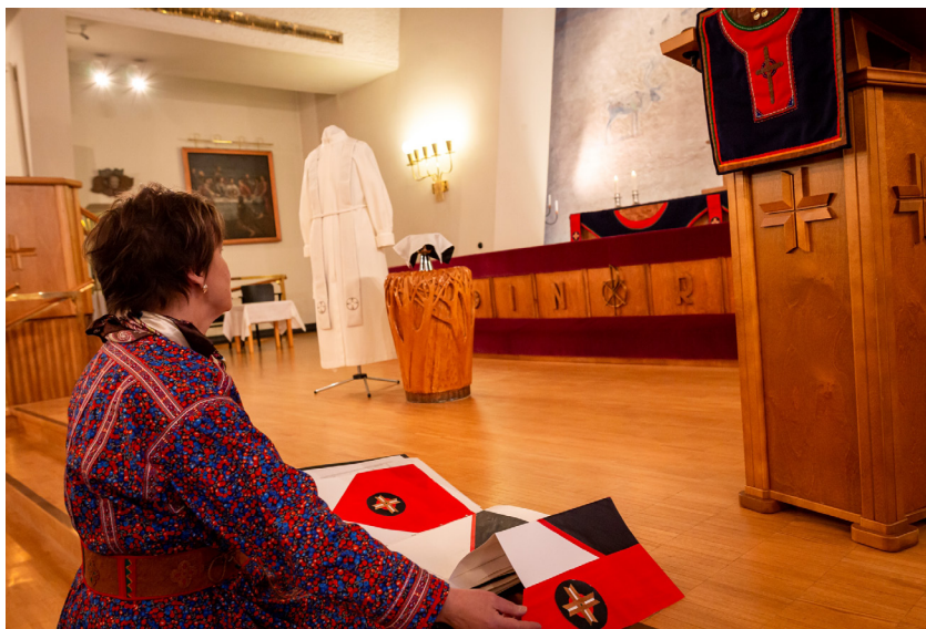
Kuva 7. Tilan kokeminen käynnisti visuaalisen tulkinnan.

telun sekä materiaali- ja tekniikkakokeilujen osalta (ks. Mäkelä 2003, 20). Keskeistä on yksilöllinen toteutus ja tulkinna: motiivin ja idean etsiminen vaativat tietoisia kokeiluja ja tuottavat perinteisestä duodjista poikkeavia ratkaisuja, jotka voivat johtaa innovatiivisiin tuloksiin (M Magga 2024, 219). Julkisen tilan kokeminen ja aistiminen sekä sen haltuunottaminen käynnisti itsessäni moniaistisen visuaalisen tulkinnan. Duodjitaide-tekstiilien materiaalien valmistaminen fyysisesti toimi ajatusten ja mielikuvien hautomona, kuten kirjoitin: ”Oli jännittävää nähdä perinteinen materiaali uudella tavalla. En ollut koskaan kokeillut