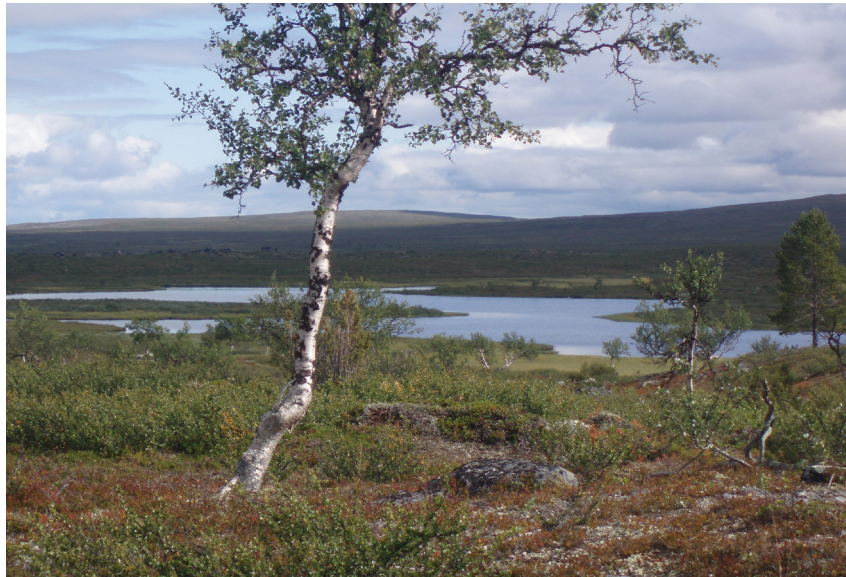
Kuva 1. Synnyinmaisemaa Jauristunturilta.

Viimeisen vuoden ajan tutkimukseni on herättänyt kiinnostusta duodjiyhteisössä kotiseudullani Enontekiöllä, ja olenkin vakuuttunut sen tarpeellisudesta ja merkityksestä varsinkin saamelaisen duodjiyhteisöni näkökulmasta. Kanssakäyminen duodjiyhteisön nuorimpien kanssa piirtää kuvan duodjin merkityksestä ja ymmärryksestä yli sukupolvirajojen: toivon, että vanhempien perinteentietäjien osaaminen välittyy nuoremmille tutkimukseni kautta. Perinteentietäjien ( árbediehtti ) tietotaito on vahvistanut tutkimukseni tietopohjaa ja näkökulmaa. Voisi sanoa, että olen ollut liikkeellä viimeisinä hetkinä, sillä tut-