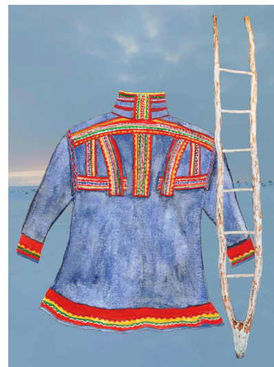
Kuva 3. Miehen gákti.

Gáktirakenne pohjautuu Jauristunturin sukujen miehen puvun malliin ja yksityiskohdiltaan Aslak-enon aikaiseen 1940-luvun mallin mukaiseen vaatteeseen. Miehen pukua tarkastellaan selkäpuolelta, joka kertoo duodjin leikkauk-