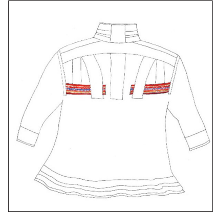
Kuvat 4, 5 ja 6. Gáktirakenne pohjautuu jauristunturilaissukujen miehen pukuun. Miehen gáktin selän koristesommittelu kuvastaa tutkimuksen käsitteellistämistä.

sesta ja koristesommittelun tavasta, yhteisön estetiikkakäsityksestä. Taustalla näkyvä maa kiinnittää vaateen ja sitä kantavan ihmisen alueelle sekä kertoo ihmisen kuuluvaisuudesta maahan ja yhteisöön.