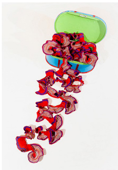
Kuva 8. Hulpaspiraali kuvastaa taiteellisen tutkimuksen vaiheita.

Holbi eli helma kiinnitetään pukuun viimeisenä. Se käsitteellistää tutkimukseni viime vaihetta, taiteellista yhteenvedoa ja tuloksia. Hulpa muodostuu verkasuikaleista ja koristenauhoista. Hulpa-spiraali symboloi taiteellista duodjitutkimustani ja sen muodostumisen vaiheita: duodji liikkuu ja esiintyy erilaisissa ympäristöissä, tiloissa ja ajassa. Kunkin aikakauden ihmisillä on oma käsityksensä kauniista duodjista. Olen tarvinnut kaikki hulpa-spiraalin vaiheet. Toisinaan hulpa kääntyy nurinpäin, kuten tutkimuskin: joskus teoreettisen ja taiteellisen osion limittäin tekeminen tun-