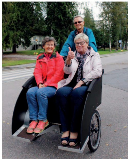
Järvenpään koeajo. Pyörällä kaiken ikää -projekti.

Pyörällä kaiken ikää (Cycling Without Age) on Tanskassa vuonna 2012 syntynsä saanut kansainvälinen kansanliike. Toiminta on jo käynnissä kymmenissä maissa ympäri maailmaa. Suomessa Pyörällä kaiken ikää