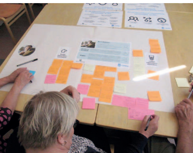
Kuva 1. Turkulaiset seniorit innostuivat uusista menetelmistä.

Turussa vapaaehtoistoiminnan kehittämisen yhteissuunnitteluun ovat ottaneet osaa