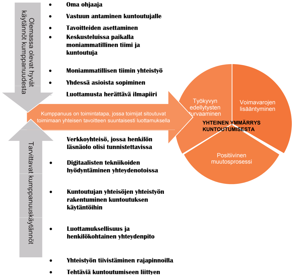
Kuvio 3. Kiipulalainen kuntoutusymmärrys.

seen pohdintaan siitä, minkälaista osaamista, toimintatapoja ja ymmärrystä yhteisöllä on. Työstämisen vaiheet ja valmis kartta sopivat kuntoutusosaamisen johtamisen välineeksi moniammatillisissa asiantuntijaorganisaatioissa. Kuntoutujan asiantuntijuus mahdollistuu kartan avulla ja auttaa vahvistamaan kuntoutujan roolia kuntoutuksen kehittäjänä.