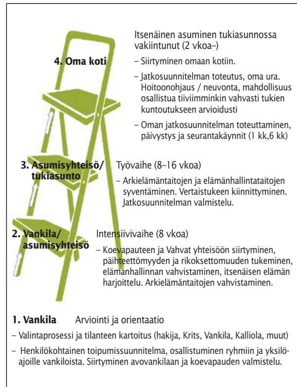
Kuva 1. Vahvat-toimintamalli

Vankilayhteistyön rakentaminen oli aikaa vaativa prosessi. Se alkoi projektin esittelyllä ja pohdinnalla, kenelle toiminta sopii ja miten asiakkaat löytäisivät projektiin; näitä keskusteluja käytiin useissa, toimintatavoiltaan erilaisissa vankiloissa. Lopulta yhteistyössä