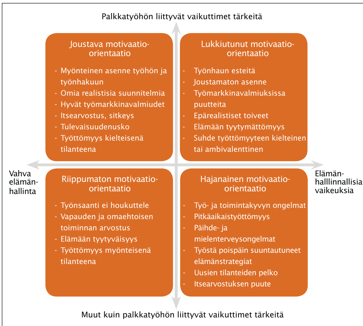
Kuvio 2. Työnhakumotivaation neljä orientaatiota aktivoinnin kontekstissa

sen asenteen nähtiin inspiroivan ja motivoivan työvalmentajaa, millä puolestaan katsottiin olevan vastavuoroista vaikutusta asiakkaan motivoitumisessa. Asiakkaan hyvät sosiaaliset taidot voivat tehdä vaikutuksen työvalmentajaan ja työnantajaan ja edistää näin hänen työllistymistään.