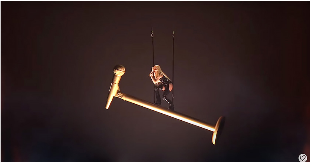
Kuvat 1 ja 2. Erika Vikman kilpaili UMK:ssa vuonna 2020 kappaleella "Cicciolina" ja 2025 kappaleella "Ich komme". Kuvakaappaukset esityksistä.