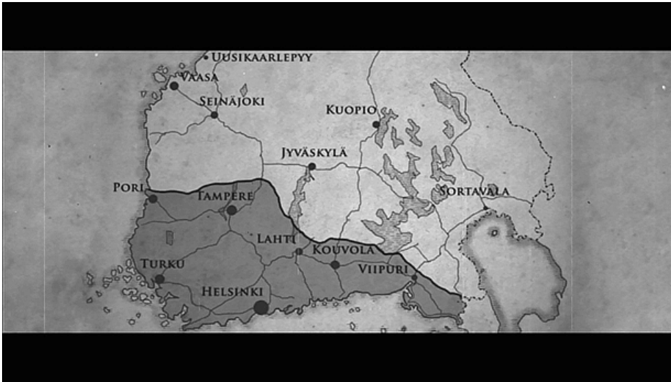
Arkistofilmiä käytetään fiktioelokuvassa vahvistamaan kerrotun tarinan historiallista uskottavuutta elokuvassa Taistelu Näsilinnasta 1918 . Kuvakaappaus DVD:ltä.

syttyi ja sitten valkoiset hyökkäivät. Mannerheimin keskeisyyttä lisää narraatiota seuraavien elokuvan alkutekstien taustalla nähtävä arkistofilm, jossa Mannerheim on näkyvästi esillä.