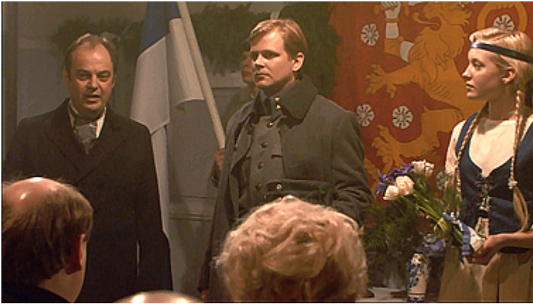
Punavankien teloituksia tarmokkaasti johtava jääkäriupseeri saa palkinnon ”kiitolliselta Suomen kansalta” elokuvassa Täällä Pohjantähden alla . Kuvakaappaus DVD:ltä.

Valkoisille vasta jääkärien saapuminen antoi mahdollisuuden asiantuntevaan koulutukseen ja joukkojen organisointiin. Punaisille tällaista vahvistusta ei tullut, minkä vuoksi kaartin taistelukyky oli loppuun asti verraten heikko ja tappiot suuria. Aapo Roselius (2006, 151–160; ”Kulissien takana” 2008; Hoppu 2009) suhteuttaa asian toteamalla, että ainoa suurempi ammattimainen sotilasjoukko Suomen sisällissodassa oli Saksan Itämeren divisioona. Elokuvissa punakaartin amatööriluonnetta alleviivataan esittämällä valkoinen armeija ”oikeana” armeijana, mitä osoittaa esimerkiksi aiemmin esiin nostamani Taistelu Näsilinnasta 1918 -elokuvan alkutekstijakson ratkaisu esittää valkoinen armeija taisteluharjoitusfilmeinä ja punakaarti staattisina potretteina.