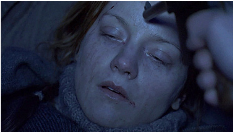
Naisvankien teloitus elokuvassa Täällä Pohjantähden alla . Kuvakaappaus DVD:ltä.