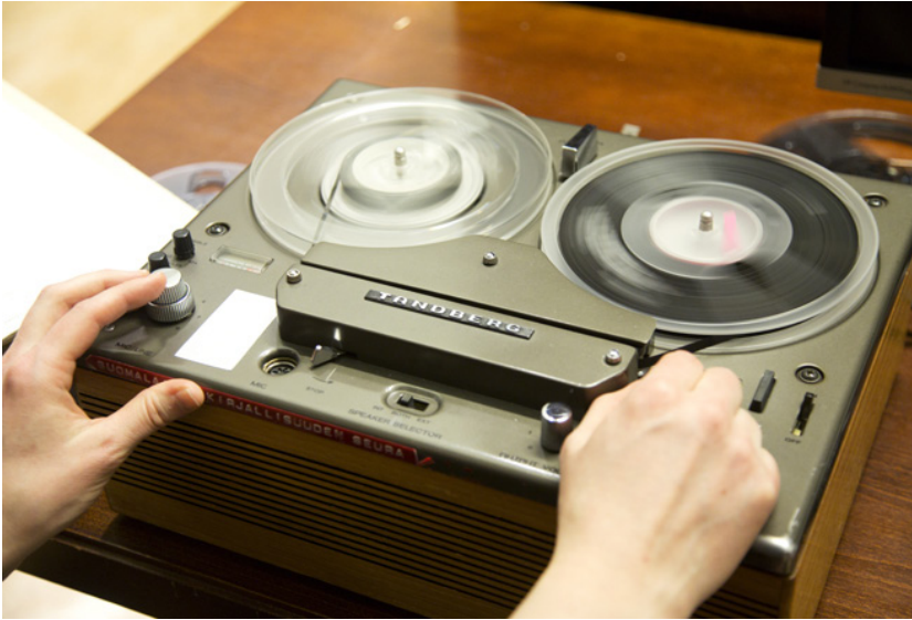
Teosta varten kuunneltiin läpi koko yli 100-tuntinen nauhoitemateriaali. Niille tallentuneiden tarinoiden lisäksi nauhat itse ovat osa menneisyyttä ja kulttuurihistoriaa.