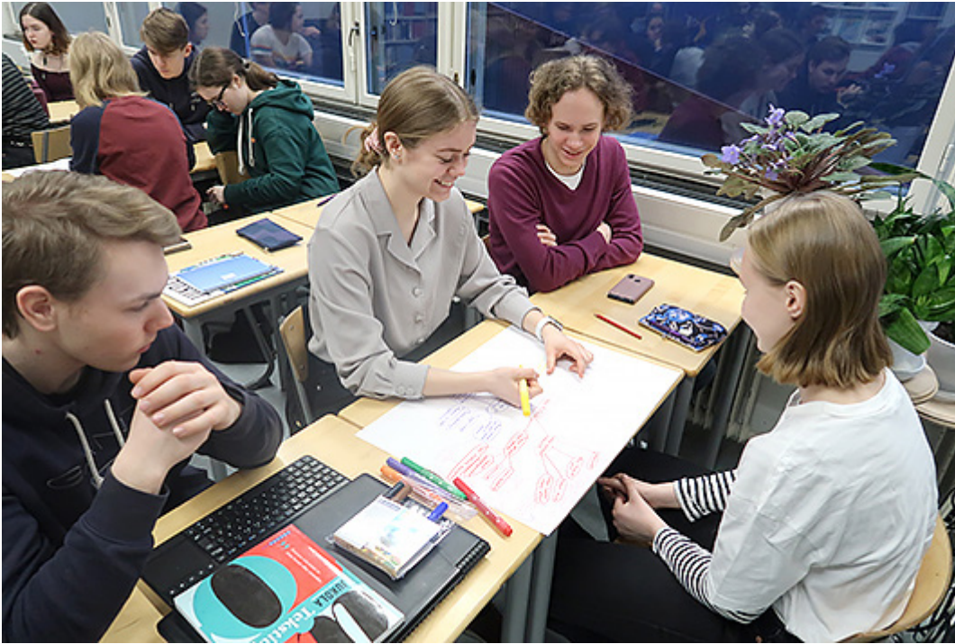
Kuva 6. Sci-fi-elokuva Ad Astra (USA 2019) mahdollistaa fysiikan, filosofian, äidinkielen ja suomi toisena kielenä -kurssien yhteistyön. Jargonin, kielen rekisterin ja moniäänisyyden merkitystä henkilökuvan luomisessa tutkittiin tekemällä pienryhmissä ajatuskarttoja.

Opettajilla mainintoja keräävät draama, komedia ja tositapahtumiin perustuvat elokuvat. Klassikoita toivovat tilausnäytännöissä nähtäviksi niin opettajat kuin lukiolaisetkin. Huoli klassikoiden unohtumisesta on myös osalla lukiolaisista, joskin on mahdollista, että opettajat ja opiskelijat viittaavat eri elokuvaan puhuttaessa klassikoista.