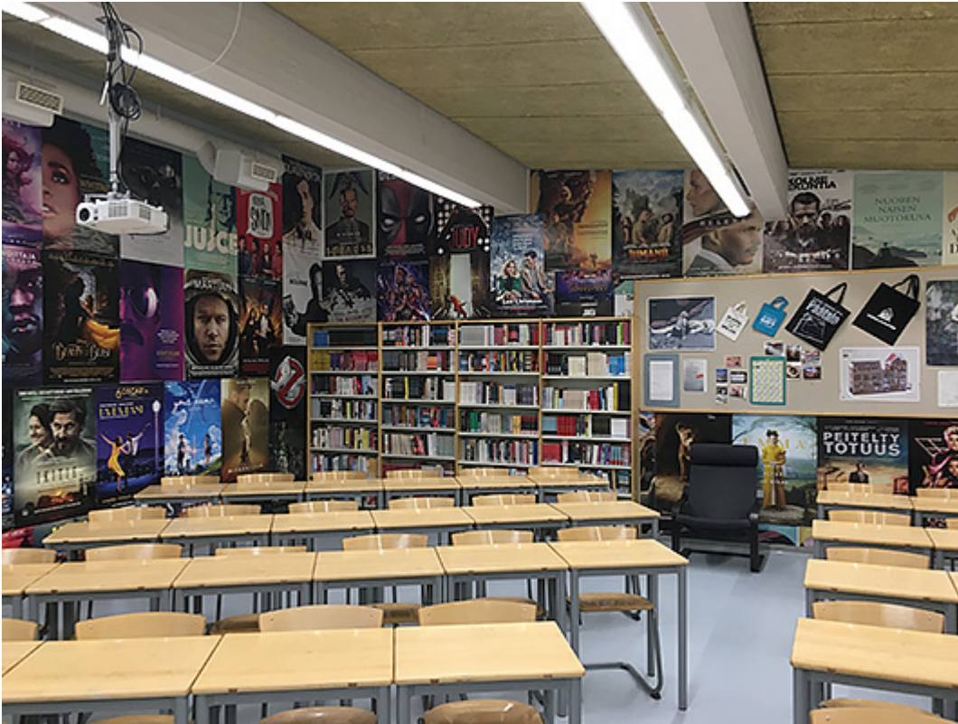
Kuva 3. Opiskelijat ovat saaneet vaikuttaa luokkahuoneen sisustukseen. Julisteseinältä löytyy usein esimerkkejä opetuksessa havainnollistettaviin asioihin.

Lukiolaisista 86 % arvioi elokuvien sopivuuden oppiaineen kurseille ja koulu-tehtäviin yli seitsemän arvoisina (asteikko 0–10) eli piti koulun valitsemia elokuva-valintoja onnistuneina. Valtaosa valituista elokuvista on ollut sellaisia, joita nuoret eivät ennen elokuvan katsomista pidettyjen ”Kuinka moni on nähnyt?”-viittaus-äänestysten mukaan olleet vapaa-ajallaan nähneet tai olisi menneet katsomaan. Ne harvat, jotka olivat nähneet jo valitun elokuvan, lähtivät mielellään uudestaan. Vaikka kyselyni toteutettiin vain omalla koulullani, Koulukino on mitä ilmeisimmin onnistunut elokuvasuosituksissaan ja oppimateriaaleissaan, jotka materiaalista riip-puen tukevat opettajan työtä taustoittamalla ja avaamalla elokuvaa tai jotka voidaan viedä luokkaan sellaisenaan.