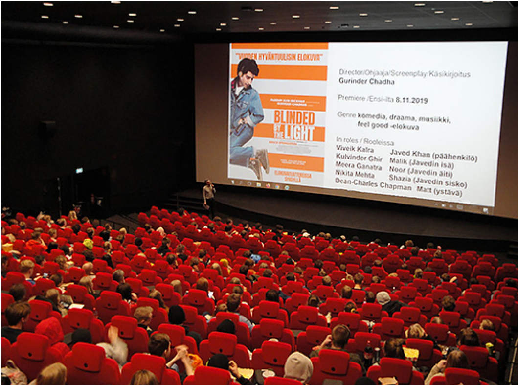
Kuva 4. Elokuvan Blinded by the Light (Iso-Britannia 2019) näytäntöä seurasi 300 Mäntyläisen yhteiskoulun ja Helsingin matematiikkalukion jäsentä: kaikki kahdeksasluokkalaisten, noin 150 lukiolaista ja 15 opettajaa. Koulu maksoi kahdeksasluokkalaisten osallistumisen. Näytöstä edelsi elokuvan alustus ja tietovisa Bruce Springsteenistä.

valvoa. Lukiolaiset tahtoisivat omat näytäntönsä ilman peruskoululaisia, ja opettajat kokevat, että lukiolaisten esimerkki rauhoittaa peruskoululaisia. Peruskoululaisten koulukinonäytännöt on hyvä järjestää alkuvuokosta, sillä torstaina nähdystä ei muisteta yksityiskohtia maanantaina. Osa lukiolaisista kaipaa lähinnä aiempaa aloitusajankohtaa, ja marginaalinen osa parantaisi tilaisuuksia jakamalla ilmaiset elokuvaliput, virvoitusjuomat ja popcornit.