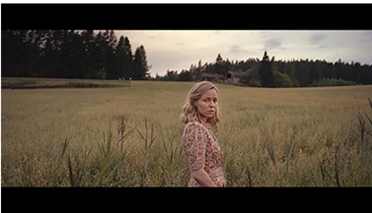
Kolmas Tuntematon sotilas -filmatisointi tuo kotirintaman osaksi suomalaisten sotakokemusten tulkintaa. Kuvakaappaus DVD:ltä.

Avainsanat: jatkosota, toinen maailmansota, nationalismi, luonto, Suomi