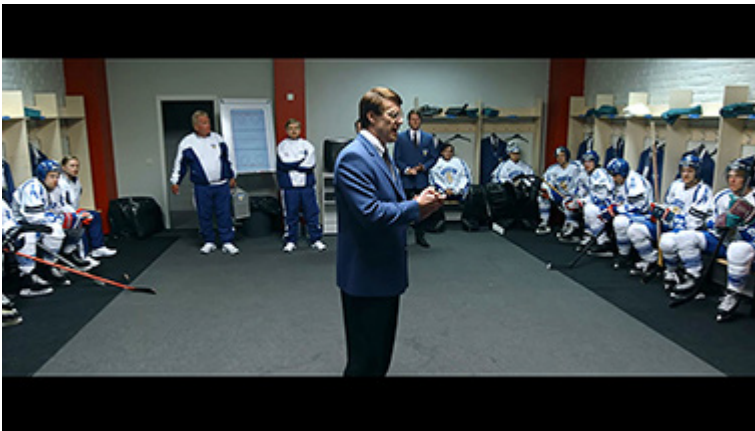
”Tutut” kiekkosankarit valmistautumassa MM-finaaliin elokuvassa 95. Kuvakaappaus DVD:ltä.

Asiasanat: jääkiekko, maailmanmestaruus, kansallistunne, suomalaisuus, yhteistyö