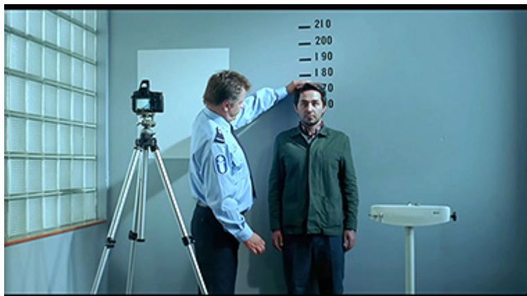
Toivon tuolla puolen kritisoii turvapaikanhakijoiden epäinhimillistä kohtelua Suomessa. Kuvakaappaus DVD:ltä.

Avainsanat: turvapaikanhakijat, rasismi, suvaitsevaisuus, luokkayhteiskunta, nostalgia