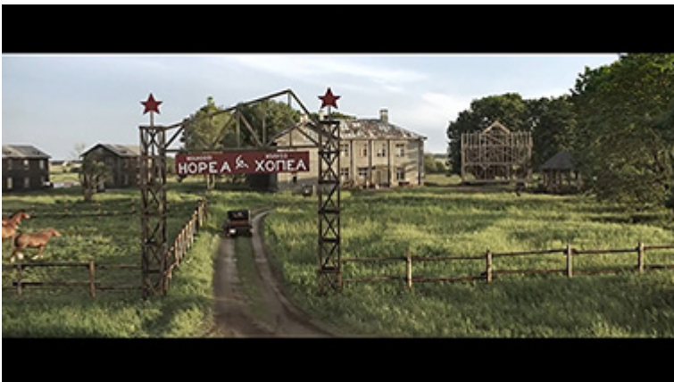
Kolhoosi 1930-luvun alun Neuvosto-Karjalassa elokuvassa Ikitie . Kuvakaappaus DVD:ltä.

Luonnolla on myös vahva, ”suomalainen” rooli elokuvassa, joka sijoittuu kolhoosiin maaseudulle. Luonto on kuitenkin pikemminkin tarkentumaton tausta kuin elävä, monimuotoinen orgaaninen kokonaisuus, kuten useassa muussa Suomi 100