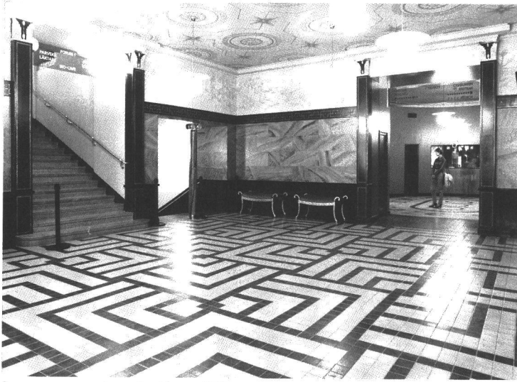
Forum -teatterin aula.

liikkuvuuden ja muutoksen nautintoja markkinoivina kokemuskoneina, ostoskeskuksen välineellisinä laajentumina, jotka molemmat myyvät paketoituja kokemuksia ja kuvia. 64