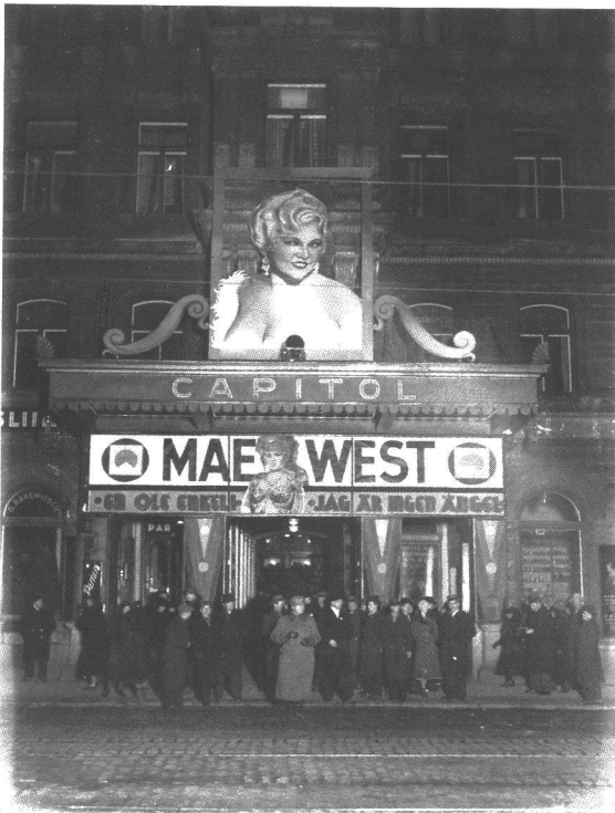
Capitolin julkisivu (1934).

Keskelle 1980-luvun nousukautta 6.11.1985 valmistunut Forum oli aikansa suurin katettu suomalainen kauppakeskus, jonka yhteydessä sijaitseva elokuvateatteri oli niinikään seitsemine saleineen ennennäkemättömän suuri. Helsinkiin oli jo vuotta aiemmin avattu Senate Center, ja Forumin lisäksi kaupungin keskustaan nousivat lähivuosina Kluuvin ja Velholinnan kauppakeskukset sekä Stockmannin tavaratalon uudisrakennus. Kauppakeskuksia kohosi 1980-luvulla myös Suomen muiden suurten kaupunkien keskustoihin: Turkuun rakennettiin Hansakortteli ja Tampereelle Koskikeskus.