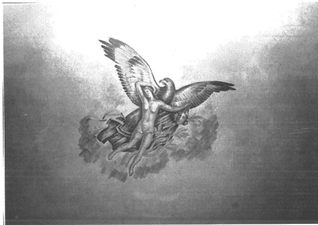
Topi Vikstedtin kattomaalaus.

yhdistää antiikin sankaritaruihin. Myös aulan istuimissa oli roomalaisia sävyjä. Capitolinus oli antiikin Forum Romanumin viereinen kukkula, Jupiterin temppeli ja valtiollisen elämän keskuspaikka, joten teatterin nimeen liittyi vastaavaa mahtipontisuutta kuin Gloriana tai Kino-Palatsiinkin.