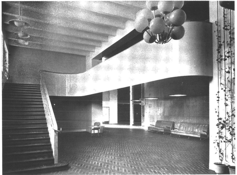
Kino-Palatsin aula.