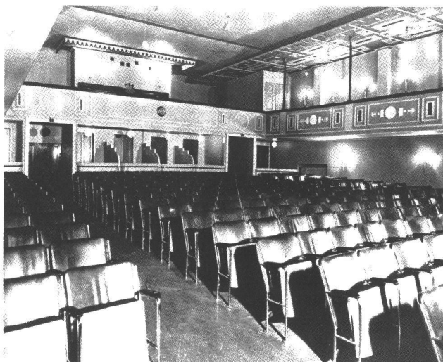
Olympian uusittu sali.

Vanhoja teattereita myös korjattiin vastaamaan ajan vaatimuksia. Elokuvateatterit kilpailivat yleisöstä ja pyrkivät palvelemaan näitä yhä paremmin ja luomaan yhä komeammat katsomispuitteet. Elokuvateatteri Olympiia kunnostettiin 12 vuoden käytön jälkeen 1919 arkkitehti August Krookin suunnitelmien mukaan. Teatterisalia levennettiin ja rakennusta korotettiin, jotta saliin saatiin parveke. Eerikinkadun puoleinen fasadi uusittiin kokonaan ja siihen lisättiin toinen ovi. Eteisaulassa oli ovien välissä kassa ja sen yläpuolella toisessa kerroksessa konehuone. Saliin oli kaksi sisäänkäyntiä ja salissa kaksi pääkäytävää. Salin takaosassa oli kummallakin sivulla kaksi ja keskellä viisi neljän hengen aitiota, joissa oli eksoottiset pienimuotoiset valaisimet. Aitioiden kaiteen reuna oli päällystetty punaisella sametilla. Salissa oli parveke ja kapeat sivuparvekkeet. Sekä salin että parvekkeen lattia nousi tasaisesti taaksepäin. Valkokankaan eteen tehtiin orkesterisynvenys. Teatterissa oli puulämmitys, jota varten salin etuosassa oli kaksi kaa-