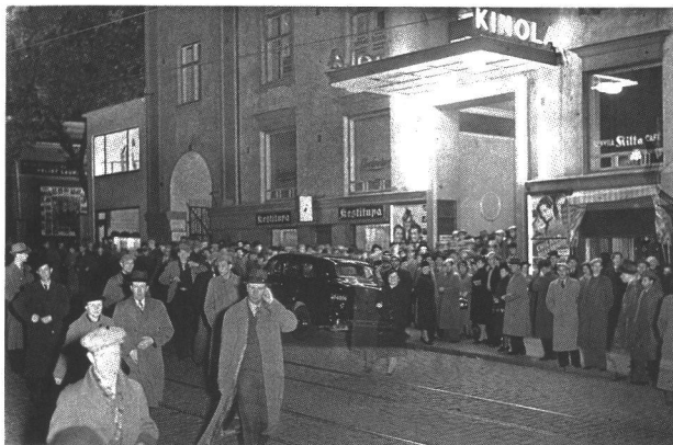
Tungosta Kinolan ulkopuolella 1930-luvun lopulla.

Kinolakin oli lähes suorakaiteenmuotoinen. Konehuone oli sijoitettu Tampereella vastikään sattuneen Imatra-teatterin palon vuoksi tiukennettujen