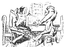
Adapted from romanticism

Luettelon ensimmäinen osa on mielenkiintoisin. Se sisältää runsaat puolitoista sataa numeroitua kohtaa tai luokkaa, joissa nimetään mielentiloja (pelko, yksinäisyys, suru), tapahtumia ja tapahtumasarjoja (maanjärjitys, metsästy) sekä tekoja (syytös, tunnustus, murha). Osa