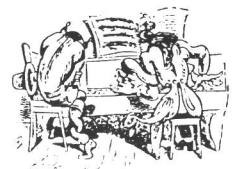
Fuga del diavolo