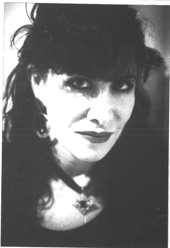
Lizzie Borden.

tään huonoja rooleja ja päivisin hän työskentelee puhelinseksi-palvelussa. Latinalla on jatkuvasti vaikeuksia yönantajien kanssa, koska hän ei halua kertoa asiakkaille aina samoja fantasioita. Eräs mies kuulee vahingossa Latinan puhelun ja haluaa tavata hänet. He pääsevät keskustelusaan todella syvälle, mutta Latina vie fantasiat liian pitkälle ja mies lopettaa soittamisen. Epäonnekseen mies joutuu mustan lesbon pidättämäksi. Seksipuhelin on tyypillistä 90-lukua.