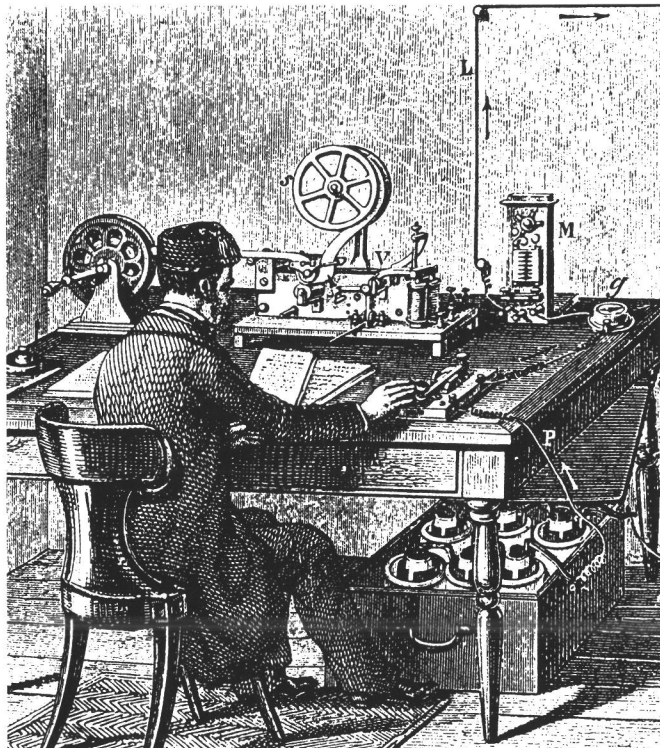
Lennätin on telekommunikaation peruskesintö, jonka kehittäli amerikkalainen Samuel Morse vuosina 1937-1843 1

Kärjistäen voidaan sanoa, että nykyisin televisio on paras tae maailman läsnäolosta, ellei peräti sen olemassaolosta; television kautta tiedämme, että olemme olemassa, mutta vain hetimitäin, kelluessamme loputtomassa ohjelmavirrassa. Tässä mielessä broadcast-