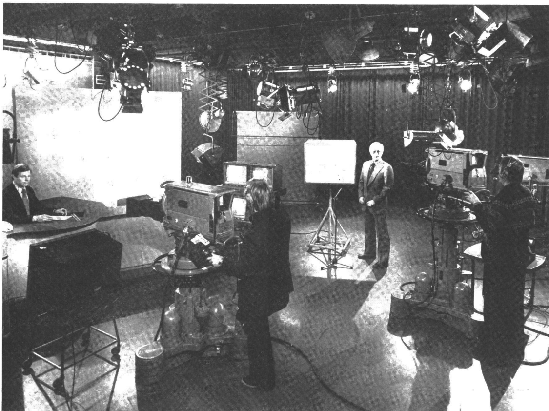
Heikki Kahilan (vas.) mukaan ensimmäisen TV-esiintymisen jälkeen kaikki yksinkertaisesti vain oli "toisin".

oleva 'mainosannos' alkaa". Hyväksi havaittiin TES-TV:n tapa sijoittaa mainokset keskelle ohjelmaa: "Ne ovat jopa ohjelman antoisimpia osia, joiden nautittavuutta ei lainkaan häiritse kuuluttajan ilmoitus ohjelman maksajasta." 61