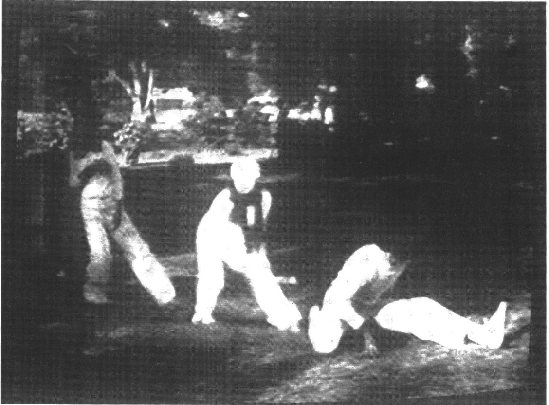
Satellite Arts Project, 1977. Keskimääräinen tanssija Marylandista kohtaa partnerinsa Kaliforniasta satelliitin avulla luodussa yhdistelmäkuvasssa.