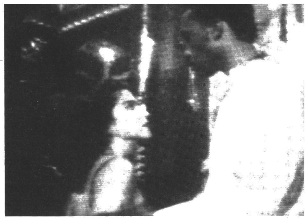
Like a Prayer

Myös rotujen väliset suhteet muodostavat keskeisen osan Like a Prayer -videossa. Madonna seuraa aina ajankohtaisia kysymyksiä. Kun päällimmäinen puheenaihe oli teini-ikäisten raskaudet, hän teki Papa don't Preach -videon, ja kun keskusteltiin pornografiasta, häneltä ilmestyi Open your Heart . Yhdysvalloissa tietoisuus rotukysymyksistä on kasvanut viime aikoina. Like a Prayer yrittää tiedos-