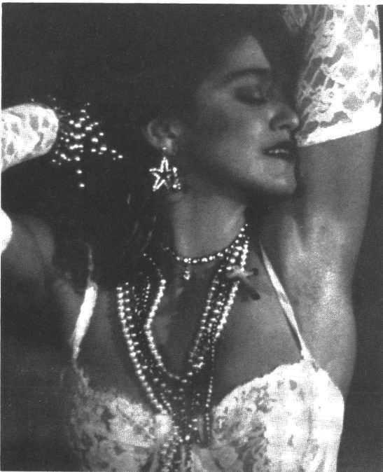
Dress like Madonna

Monet teini-ikäiset eivät pidä kuvallisesta asusta, jonka videon tekijät ovat valinneet suosikkikappaleelle. He rakentavat mieluummin omia sisäisiä kuviaan, joita kukaan toinen ei voi kontrolloida. Usein kun nuori näkee videoversion pitämästään kappaleesta, se sotiikin niin kovin hänen omia käsityksiään vastaan, että kappale menee pilalle. Syy radion ja äänilevyjen säilymiseen on myös siinä, että ne sallivat mielen rakentaa omia kuviaan.