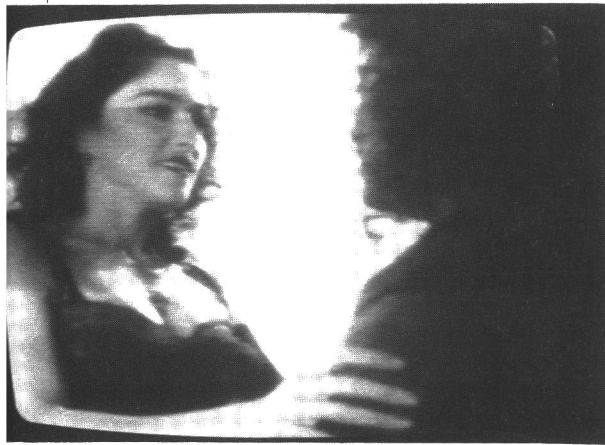
Like a Prayer

Aivan oikein, 80-luvulla käsitteen feminisimi korvasi monikko feminismit. Muille kuin valkoisille naisille kyse on enemmästä kuin sosiaalisesta sukupuolesta (gender). Nyt problematisoidaan enemmän. Esimerkiksi minä olen menestynyt, akateemisesti koulutettu ihminen, ja jotkut nuoret syyttävät nyt, että minä ja kaltaiseni olemme pettäneet heidät. En kuitenkaan koe olevani petturi. Pikemminkin asemani instituutiossa antaa minulle enemmän valtaa vaikuttaa sisältä käsin. En todellakaan myynyt