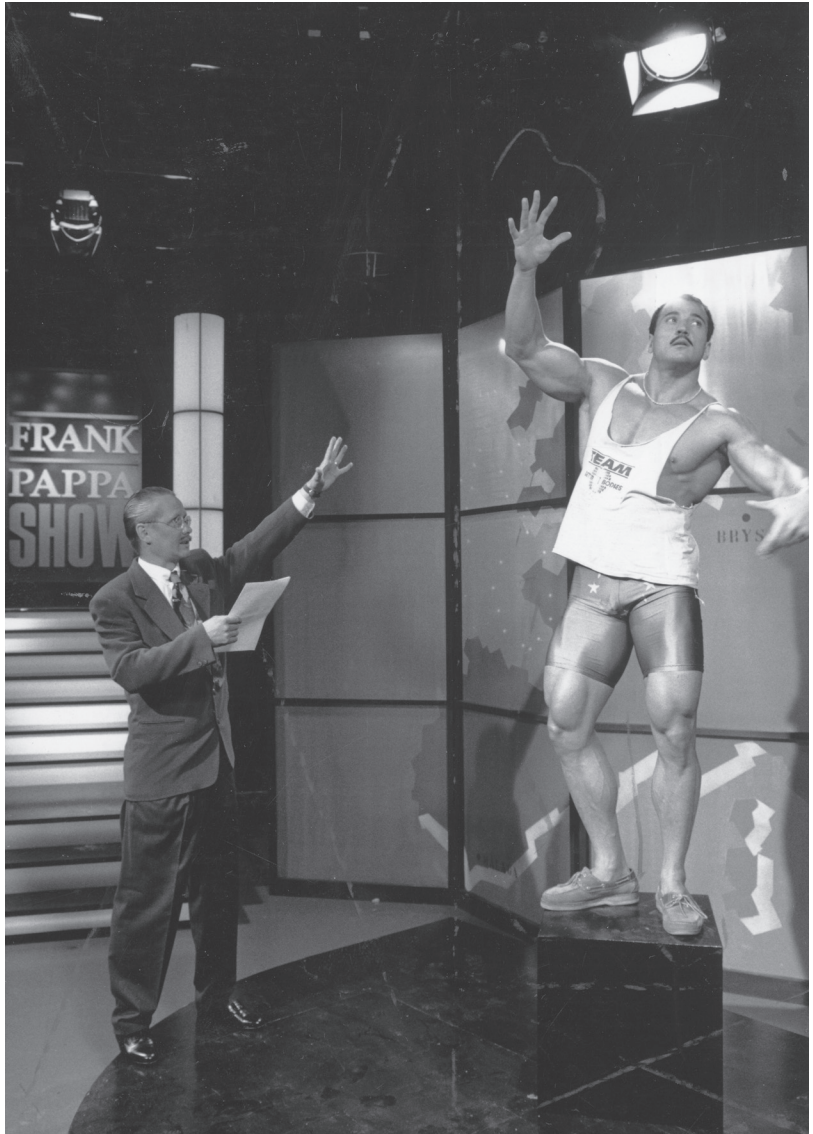
Kolmoskanava hankki ohjelmistonsa kymmeniltä eri tuotantoyhtiöiltä, kuten Broadcastersilta, jonka tuotantoa oli muun muassa Frank Pappa Show .

kodin asuntomarkkinat ). Vielä vuonna 1991 Kolmostelevisio raportoiti ostaneensa ohjelmia noin 40 kotimaiselta tuotantoyhtiöltä, mutta kanavauudistuksen lähetessä määrä putosi pariinkymmeneen. Tuntimääräisesti Kolmostelevisio osti ulkopuolisilta kotimaisilta yhtiöiltä yhä 300–400 tuntia ohjelmaa vuosittain, mutta kun valtaosa koostui vakiintuneista sarjoista, uusien tuottajien kynnys päästä markkinoille kasvoi alkuvuosia korkeammaksi.