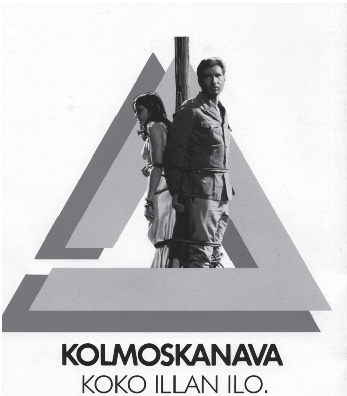
Toisin kuin Yleisradiolta ohjelmatilaa vuokrannut MTV Kolmoskanava tarjosi viihteenjanoisille katsojilleen ”Koko illan ilon”.