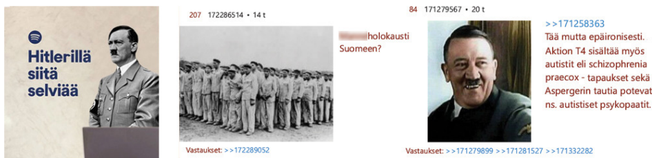
Kuva 3. Joukkosurmaan viittaavissa sisällöissä helposti ymmärrettävät viittaukset natsi-Saksaan ovat yleisiä. Tällöin tappamista ja väkivaltaa ei tarvitse eksplisiittisesti mainita. Kuvakaappaus.

Verkkokeskusteluissa julkaistu sisältö voi olla väkivaltaista, vaikkei siinä eksplisiittisesti kuvailtaisikaan väkivaltaa. Epäinhimillistävissä sisällöissä väkivalta ilmenee yksilöiden tai ryhmien ihmisarvon kyseenalaistamisena. Väkivaltaisen toiseuttamisen muodoista epäinhimillistäminen kulkee Sattunnainen-keskustelualueen teksti- ja kuvasisällöissä muiden toiseuttamisen