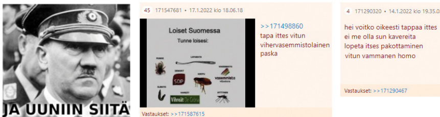
Kuva 1. Kohtaavat väkivaltaiset kehotukset Toista kohtaan ilmenevät Satunnainen-keskustelujen sisällöissä kuvallisina ja tekstuaalisina eksplisiittisinä itsemurhakehotuksina. Kuvakaappaus.

6 Monilla verkkokeskustelu-alustoilla sisältöjä voi kommentoida vastaus-toiminnolla, jolloin kommenttien tai sisältöjen yhteys näkyy keskusteluketjussa.