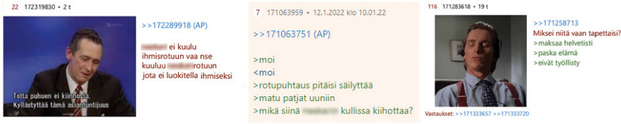
Kuva 4. Epäinhimillistävissä sisällöissä Toisen ihmisarvo kyseenalaistetaan joko kiistämällä eksplisiittisesti tämän ihmisyyden tai viittaamalla tämän ”hyödyttömyyteen” tai ”arvottomuuteen”. Kuvakaappaus.

muotojen rinnalla. Yllä olevissa aineistoesimerkeissä epäinhimillistäminen liittyy niin joukkosurmaan (ks. myös Haslam 2006, 252) kuin myös Toiseen kohdistuvaan fyysiseen väkivaltaan (kuva 4). Nimittämällä Toista geenijätteeksi tai ihmisaastaksi verkkokeskustelija syventää ja legitimoii kuilua itsensä ja Toisen välillä. Väkivallaksi tulkittava ihmisyyden eksplisiittinen kyseenalaistaminen yhdistyy aineistossani myös sisältöihin, joissa Toista kuvaillaan esineenä, kuten ”matupatjana”. Kuvakaappauksessani matupatjoilla viitataan ei-valkoisten maahanmuuttajamiesten kanssa seksisuhteessa oleviin naisiin tai ylipäättään naisiin, joiden nähdään suhtautuvan liian suopeasti maahanmuuttoon. Esineellistävä kuvaaminen on tyypillinen keino varsinkin naisten epäinhimillistämässä, jolloin kohteelta pyritään kieltämään hänen inhimillinen toimijuutensa (Haslam 2006, 253). Matupatja-nimitys on osa pitkäikäistä maahanmuuttovastaista diskurssia, jossa ulkomaalaisten nähdään joko ”vievän” suomalaiset naiset tai kohdistavan heihin seksuaalista väkivaltaa (Sundén & Paasonen 2018, 645). Naisvihamielisyys ja rasismi linkittyvät toisiinsa, kun antirasismia tai feminismiä kannattavat naiset kuvataan monikulttuurisuuden ihannoijina ja siten näennäisen oikeutetusti (seksuaalisen) väkivallan kohteina (Horsti 2016, 1451; Saresma 2017, 234).