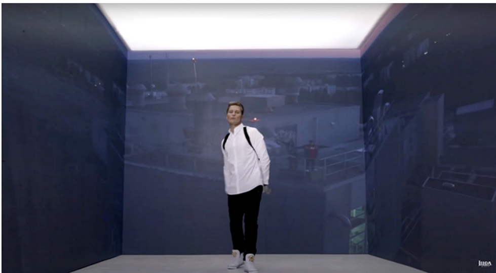
Kuva 6. Cheekin artistiuran viimeinen ”Enkelit”-video on minimalistinen tuotanto, jossa artistia kehystävän avoimen kuution seinille heijastuu elämäkertaelokuvan kohtauksia. Kuvakaappaus ”Enkelit”-videosta (2017) Liiga Musicin YouTube-kanavalta.

”Enkelit”-video on Cheekin artistiuran viimeinen ja edeltäviä esimerkkejä minimalistisempi tuotanto. Kun kahdessa aikaisemmassa musiikkivideossa korostuu dynaaminen liike, nyt ilmaisuvoima perustuu staattisuuteen, jonka taustalla liike on toisena tarinalinjana. Valtaosan ”Enkelit”-videosta Cheek räppää kappaletta avoimen kuution sisällä. Kuution sisäseinillä kulkee kronologisesti lapsuuden, nuoruuden ja aikuisuuden tapahtumia esittäviä Veljeni vartija -elokuvan kohtauksia, jotka ovat dialogisia sanoituksen kanssa. Elokuvan kohtaukset vaihtuvat toistuvasti myös koko ruudun kuvina ensisijaisen tarinan asemaan. Musiikkivideo yhdistyy jälleen Stockwellin (2020, 199–200) kuvaamaan kontekstiovien kehysten muuntamiseen: hahmon kehukseen sitomisen ja irrottamisen liike heijastaa etenkin liikettä henkilökohtaisten muistojen, uskomusten ja mahdollisuuksien välillä sekä liikkeen tuottamaa muutosta. Niukoilla visuaalisilla ratkaisuilla musiikkivideo luo moniulotteisen hahmon ja tulkinnan taiteenlajiin kohdistuvasta rakkaudesta. Suhteessa taiteilijuuteen kokonaisuudessa korostuu merkitys, jossa matkan varrella reflektoitu taiteenlajiin kohdistuva rakkaus on staattista, vaikka liike (reaalitodellisuudessa myös Cheekin koko artistiura) saavuttaa jonkinlaisen päätepisteen.