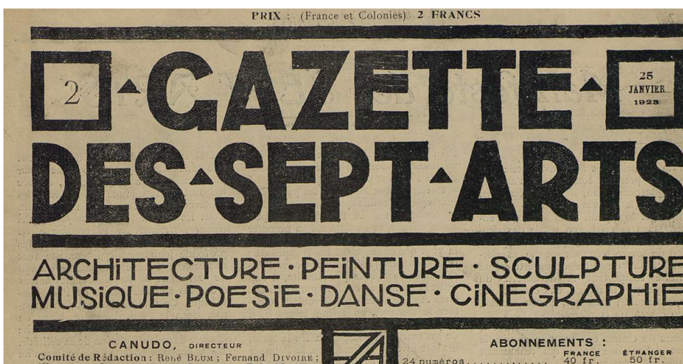
Kuva 3. L’Usine aux images -teoksen (1926) kansi sekä Canudon perustaman La Gazette des sept arts -lehden kansikuvia. Lähteet: Kirjoittajan skannaus & Ciné-Ressources, www.cinerecources.net .