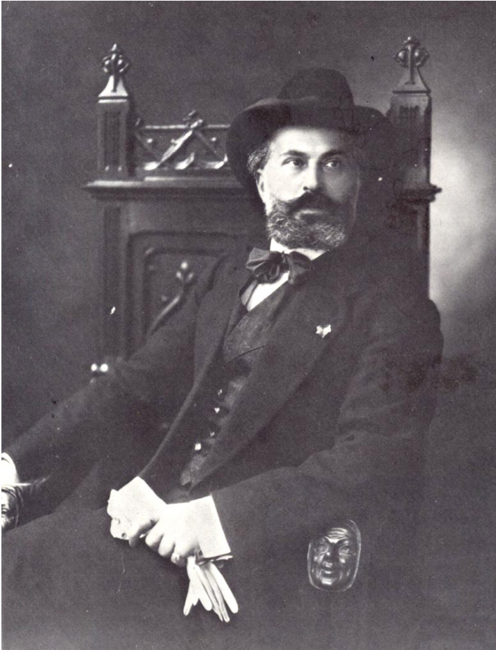
Kuva 1. Ricciotto Canudo vuonna 1913.

Canudon vuonna 1921 perustamassa elokuvakerho C.A.S.A.:ssa ( Club des amis du septième art , ”Seitsemännen taiteen ystävien kerho”) ja hänen vuonna 1922 perustamassaan La Gazette des sept arts -lehdessä (”Seitsemän taiteen lehti”).