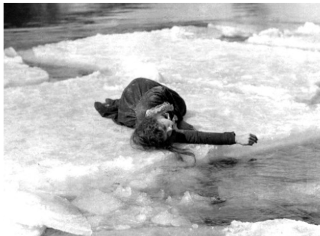
Kuva 6. Kuvakaappauksia elokuvista Vuori-Ejvind ja hänen vaimonsa (1918), Nanook – pakkasen poika (1922), Von Morgens bis Mitternacht (1920) ja Läpi myrskyn (1920).

voimaksi" ( force-ambiance ). Se kattaa paitsi näkyvän ympäristön ja luonnon, myös esimerkiksi eläimet osana ympäristöä. Sitä voivat edustaa myös koneet, kuten juna elokuvassa Pyörä ( La Roue , Ranska 1923), lentokone elokuvassa L'Autre aile ("Toinen siipi", Ranska 1923) tai laiva elokuvassa Kaikki isänmaan puolesta! ( La Bataille , Ranska 1923). (Canudo 1995/1923c, 304.)