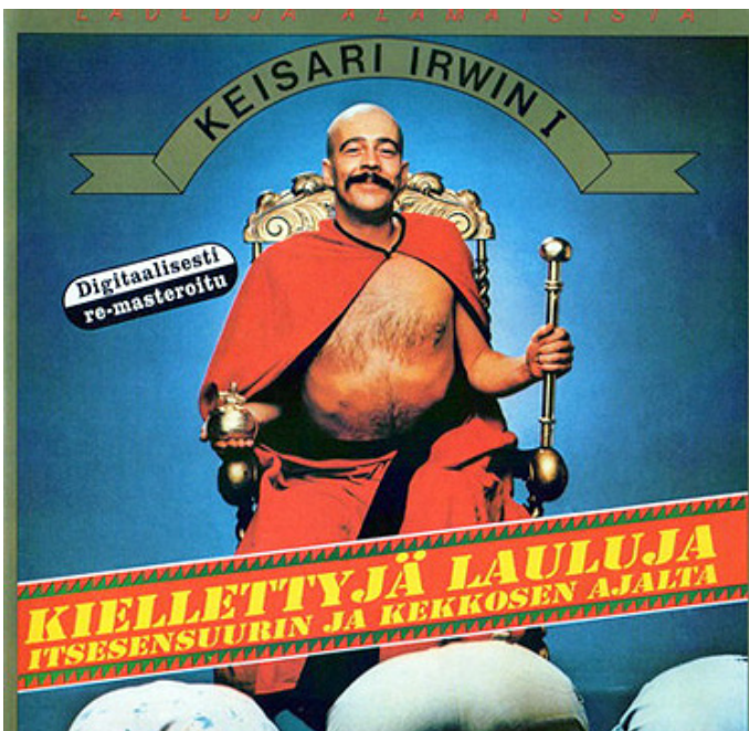
Suomalaisen protestilaulun kärkinimi Irwin Goodman ei malttanut olla ottamatta musiikissaan kantaa Kekkosen vallankäyttöön. Kuva: ”Keisari Irwin I” -levyn kansikuva.

Myös Irwin Goodman käsitteli Kekkosen poliittista asemaa levytyksissään ”Pieni iltasatu” (1970) ja ”Suomalainen iltarukous” (1979) (säv. Irwin Goodman, san. Vexi Salmi salanimellä Emil von Rete). ”Pienen iltasadun” ironisessa sanoituksessa mainitaan ”Härmlandin” valtakuntaa tasapuolisesti hallitseva kuningas Urhea. Kekkonen rinnastaminen kuninkaalliseen viittaa presidentin poikkeuksellisen vahvaan asemaan ja tapaan hallita. Laulussa sivalletaan myös sarkastisesti, kuinka ”kuningas Urhea on luonut Härmlandista todellisen demokratian esikuvan”.