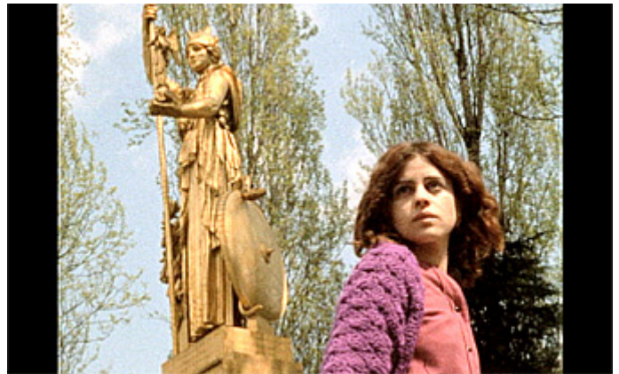
Näyttämöllepano ( mise en scène) on keskeistä Rivetten elokuvissa, kuten Out1.

Kriitikon uransa aikana Rivette muutti ja täydensi useaan kertaan käsitystään termistä näyttämöllepano, jonka hän liitti ajatukseen jostakin erityisesti elokuvalle ominaisesta. Termi näyttää juontavan juurensa yhtäältä teatteriin, joka taidemuotona kiinnosti Rivetteä, koska sen myötä oli mahdollista tehdä ero elokuvaan – erityisesti teatteria ja elokuvaa yhdistävän ja toisiinsa lähentävän näyttelijäntyön ansiosta. Toisaalta termi jättää tilaa kirjalliselle perinnölle ennen kaikkea viittaamalla tekstiin, joka on ”pantava näyttämölle” teatteriesitystä varten. Tästä huolimatta Rivette ei lakannut koskaan esittämästä, että näyttämöllepano on se ”moderni” paikka, jossa ajatus muuttuu muodoksi. Näyttämöllepano on elokuvalle kuuluvan arvoituksen paikka, jossa ajatus ilmenee jollakin toisella tavalla. Tästä johtuen elokuvan ja muiden taiteiden välille on rakennettava hienovaraisia eroja (ohi viittausten tai näkyvien lähteiden) mutta myös otettava huomioon modernin ajattelun mahdollisuus, joka rakentuu muiden taiteiden kanssa vuorovaikutuksessa olevan elokuvan muodon modernismille (ohi adaptaation tematiikan). Yleisellä tasolla ajattelun moderni esittäminen ( mise en scène ) lainaa elokuvallisilta muodoilta.