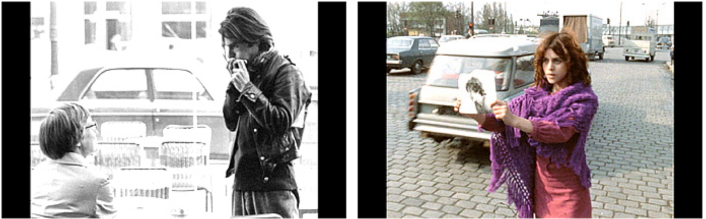
Rivetten Pariisi on salaperäinen ja samaan aikaan täysin realistinen. Kuvat: kuvakaappauksia elokuvasta.

”jatkuu”-maininta jääkin puuttumaan elokuvasta, on selvää, että teoksen kesto voisi ylittää nykyiset 12 tuntia ja 40 minuuttia.