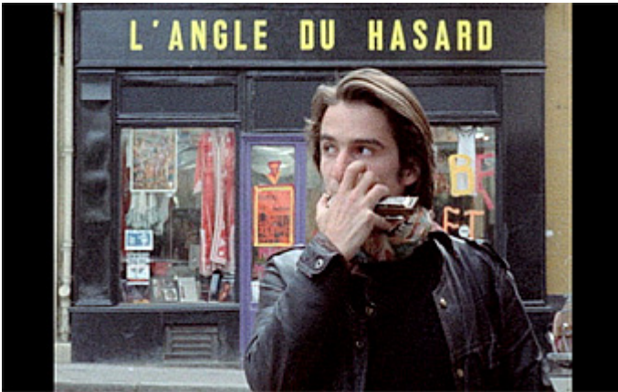
Out1 juontaa juurensa varhaisempaan toteutumatta jääneeseen hankkeeseen Out zéro .

opistokaupungissa, kuten Aix en Provence. Tarkoitus oli seurata tätä ryhmää kolme tai neljä vuotta: teoreettisesti seurue on pysynyt samana, mutta todellisuudessa sen kaikki alkuperäiset jäsenet ovat kadonneet, kohtaamispaikat ovat vaihtuneet, arjen rituaalit ja kielen koodit ovat muuttuneet. Kaiken taustalla on hyvin tšehovilainen johtolanka... Kyseinen hanke oli olemassa ainoastaan päässäni, en kirjoittanut siitä sanaakaan, mutta tarkka nimi Out löytyi nopeasti.” 5