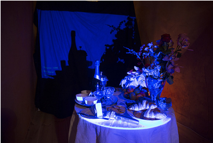
Still life.

Päätös olla rajaamatta metodia, teemoja ja kestoja johti siihen, että rajasimme kuvan. Tutkimme, mitä kuvan lävitse tihkuu ja mitä jää ulkopuolelle. Esittämällä asetelman ennen ja jälkeen tapahtuman pohdimme teon, tekemisen, teoksen ja tekijän välisiä suhteita. Projisoinnin valokeila kuitenkin paljasti muuten näkymättömät hiukkaset, jotka leijailivat sinisessä valossa. Kysymys kääntyi siihen, voiko elokuva kuvata tapahtumattomuutta.