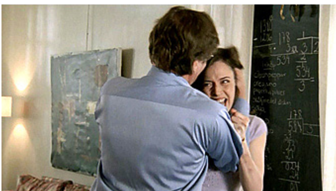
Kuvat 13 ja 14 (kuvakaappaukset DVD:ltä). Wallander: Kylähullu . Väkivaltaa ei ohiteta.