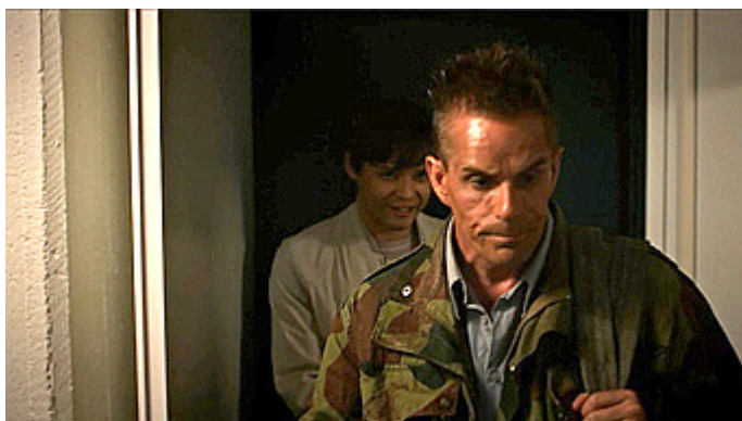
Kuva 21 (kuvakaappaus DVD:ltä). Vares – Huhtikuun tytöt . Tristan etualalla.