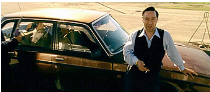
Kuvat 1–2 (kuvakaappaukset DVD:ltä). V2 – Jäätynyt enkeli . Huoltoaseman pihalla.

rinkäsitysten varaan (esim. Herkman 2001, 369–370; Bergson 1994, 76–83). Väkivallan uhrin käyttäytyminen kohtauksen alussa rehvakkaan itsevarmoina tulta savukkeeseen ystävällisesti pyytävää Hopeaa kohtaan (kuva 1). Yhtäkkiä Hopea iskee nyrkillä toista miestä, joka lentää autoa päin. Uhrin status romahtaa (kuva 2). Tämän jälkeen Hopea pahoinpitelee myös toisen miestä. Väkivallan aikana kohtauksessa käytetään tehokeinona rock-musiikkia, joka vahvistaa väkivallan intensiteettiä. Komiikkaa rakennetaan kohtauksessa myös yhteensopimattomuuden varaan yhdistämällä yllättäviä asioita sekä dialogissa että visuaalisessa kerronnassa (ks. esim. Herkman 2001, 370). Näin tehdään esimerkiksi kohtauksen lopussa, jossa uhrin istuvat autossa verisinä ja puolittajuttomina. Hopea laskee ikkunasta auton täyteen bensaa ja puhuu rauhallisen ystävällisesti: ”Eipä sitten muuta kuin turvallista matkaa. Katos, katos olihan mulla täällä sytkäri.” Hopea kaivaa sytyttimen taskustaan (kuva 3). Uhrin tajuavat yhtäkkiä auton olevan täynnä bensaa ja ajavat kauhuissaan pois. Komiikkaa rakennetaan sen ristiriidan kautta, että väkivaltaisesti toimiva Hopea puhuu ystävällisen leikkisästi. Bensaa täynnä oleva auto ja yllättäen esiin kaivettu sytytin luovat vaarallisen elementin, ja komiikka syntyy yllätyksellisestä käänteestä (sytytin) ja ristiriidasta (ystävällisen rauhallinen toiminta ja vaarallinen tilanne).