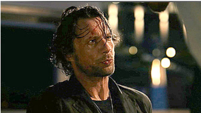
Kuva 8 (kuvakaappaus DVD:ltä). Vares – Huhtikuun tytöt . Vares ottaa iskuja vastaan.