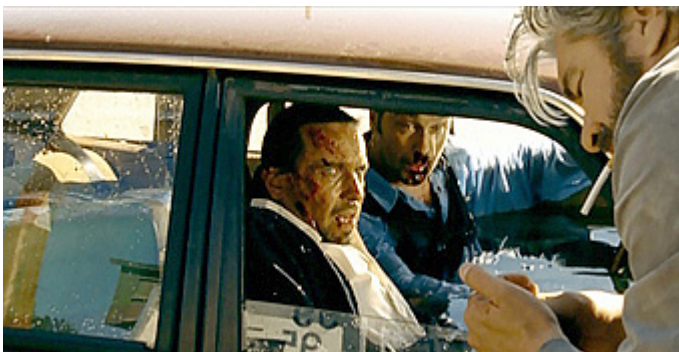
Kuva 3 (kuvakaappaus DVD:ltä). V2 – Jäätynyt enkeli . Bensa ja sytytin luovat vaarallisen elementin.