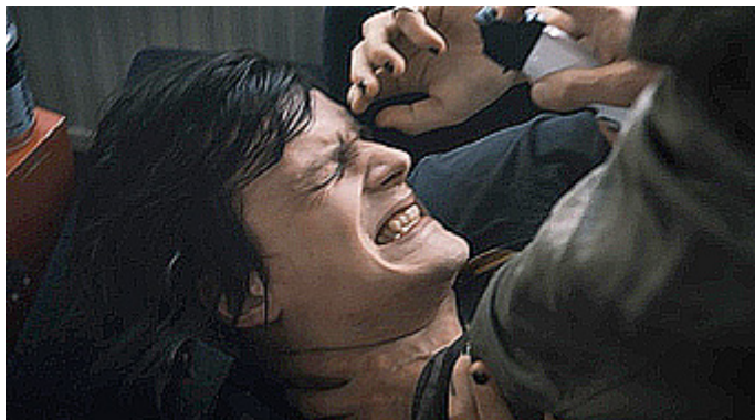
Kuvat 4 ja 5 (kuva- kaappaukset DVD:ltä). Vares – Sukkanau- hakäärme . Väki- valta vaihtuu kahvihetkeen.

tästä analysoin seuraavaksi kahta kohtausta Wallander -elokuvasta Valokuvaaja . Elokuvan yhdessä kohtauksessa miespoliisi Stefan menee hakemaan kuuluisaa valokuvaajaa Robertia (Thomas W. Gabrielsson) poliisiasemalle kuulusteluja varten. Robert vastustaa pidättämistä, minkä seurauksena miehet painivat ja