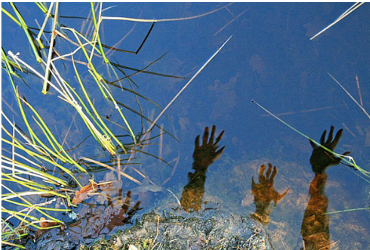
Kuva 2: Valokuva videolta Minun silmin , Najma Yusuf. Tekijä kertoo kuvasta:

Myös videoinstallaatio Minun silmin (24 min) raotti nuoren naisen näkökulmaa moninaisten tilojen ja paikantumisten risteämissä. 7 Se syntyi tekijän vuosina 2010–2013 Suomessa, opiskelumaassa Englannissa ja vierailulla Somaliassa ottamien valokuvien ja niiden analyysin pohjalle, jossa hän tarkasteli esimerkiksi omaa taustaansa, suhdettaan erilaisiin kulttuureihin, valokuvausharrastustaan ja paikantumisiaan yllirajaisissa tiloissa (kuva 2). Videolla tekijä kuvaa ja pohtii myös kulttuurien eroja ja samankaltaisuuksia, uskonnon merkitystä, arkkitehtuuria ja yhteiskunnallisia rakenteita eri yhteisöissä ja suhdettaan ”kotimaihinsa”. Video oli ensimmäisen kerran esillä näyttelyssä Siirtolaisuusinstituutissa Turussa vuonna 2013. 8 Teimme aineistosta myös kirjan, joka samoin kuin nuorten miesosallistujien kanssa aiemmin julkaisemamme teos, avasi hieman erilaisen näkökulman aineistoon kuin audiovisuaalinen tarina. 9