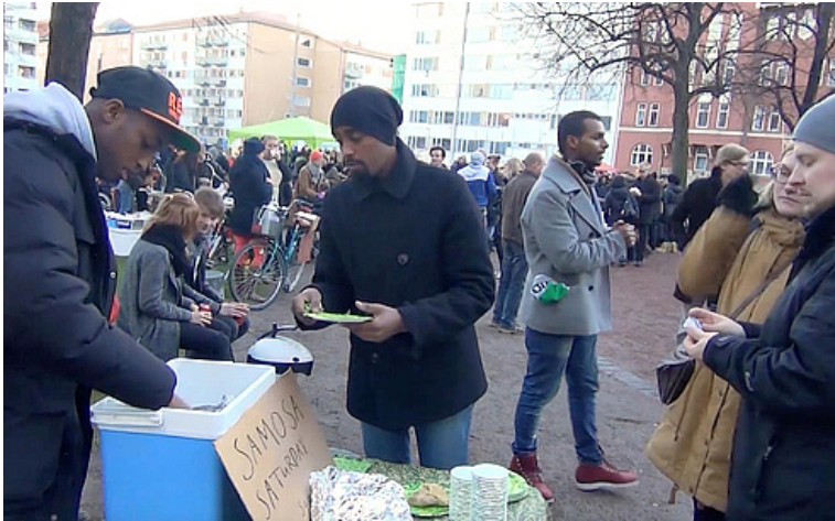
Kuva 3: Osallistujat myymässä samosa-piirakoi- ta Karhupuistos- sa Helsingin Kal- liossa (näyttöku- va videolta).

10 Shoo Dhawoow, kuten nuoret ilmauksen kirjoittivat, on somialainen tervehdys ja tarkoittaa "tule lähemmäs".