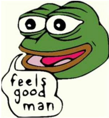
Kuva 4. Matt Furien piirtämä alkuperäinen Pepe (2006).