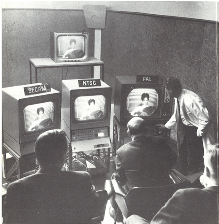
Kuva 2. Yleisradio testasi kansainvälisiä väritelevisiosignaaleja ennen päätymistä saksalaiseen PAL-järjestelmään. Kuva: Kaarle Stewen: Tämä on televisio , 1968.

kuvan ja television jako yleisessä tilassa ja kotona katsottavaan mediumiin oli kuluttajille selvä, niin kasetti-tv sijoittui näiden väliin (vrt. Bolter & Grusin 2000, 186; Kortti 2007a, 154).