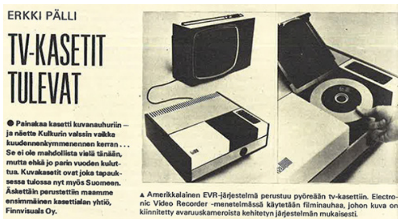
Kuva 1. TV-kasettien ennakkojulkisuus kytkettiin myös avaruusteknologiaan.

Yleisradiopolitiikan historian osalta keskeisenä tutkimuskirjallisuutena olemme hyödyntäneet Raimo Salokankaan laatimaa Yleisradion instituutiohistorian toista osaa Aikansa oloinen (1996), jossa tekijä tarkastelee keskeisintä suomalaista sähköisen joukkoviestinnän toimijaa muuttuvien viestintäpoliittisten haasteiden kautta. Lähestymistapamme tulee suhteellisen lähelle teknologioiden kotoutumisen tutkimusta (mm. Pantzar 2000; Peteri 2006), mutta päämäärämme on toisaalla. Emme tutki videolaitteiden tuloa kodin teknologioiksi, vaan kotoutumista edeltänyttä yhteiskunnallista sananvaihtoa.