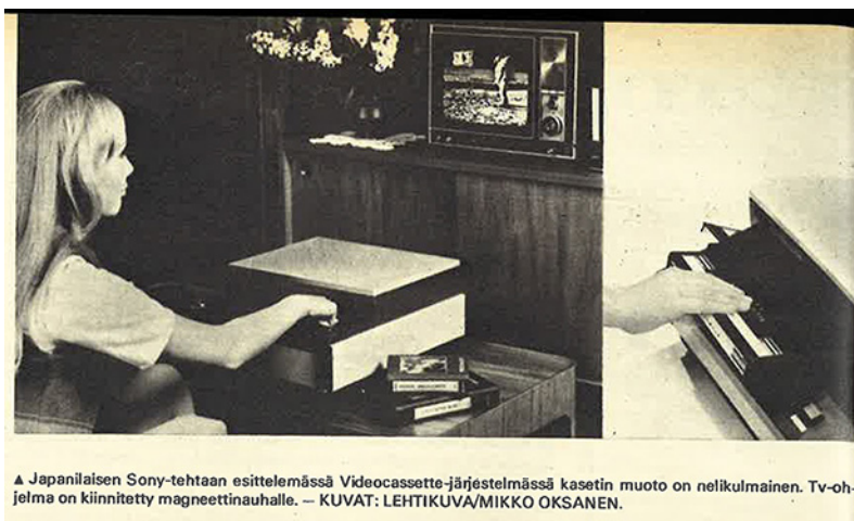
▲ Japanilaisen Sony-tehtaan esittelemässä Videocassette-järjestelmässä kasetin muoto on nelikulmainen. Tv-ohjelma on kiinnitetty magneettinauhalle.

Kasettien tuottajille kannattavana sisältönä visioitiin ennen kaikkea viihdettä ja opetusta (ks. esim. "Televisiokasetit käyttöön Suomessa parin vuoden päästä". AL 6.4.1971). Sosialidemokraattisissa Saimaan Sanomissa Heikki Peltonen maalaili, kuinka opetuskasetteja toimitettaisiin välttämättömiksi osiksi opetuspaketteja. Muuhun käyttöön kotimaisen sisällön tuottaminen nähtiin kalliina, "ellei tyydytä esim. vanhojen kotimaisten elokuvien kopioimiseen