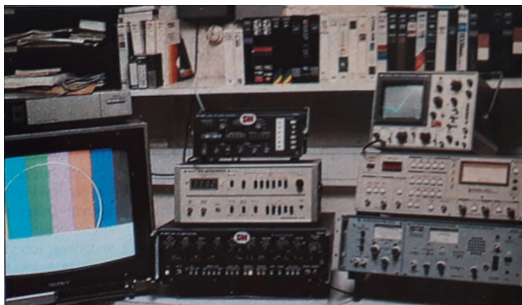
Kuva 5. Aikakauslehti Tekniikan maailman testikeskuksessa tutkittiin TM-vertailuissa tai testeissä esiintyvien videonauhureiden kuvantoisto-ominaisuuksia. Kuva: Tekniikan maailma , videolisä-sivut, 17/1983.

Kasettitelevisio, joka vuoden 1971 julkisuudessa rakentui, ei ole sama teknologia kuin tuntemamme videonauhuri. Miten visiot sitten toteutuivat ja kuinka kumouksellinen teknologia olikaan näin jälkikäteen arvioitaessa? Amerikkalaisten video-ohjelmien ylivalta oli toteutunut ainakin 1990-luvun katsannossa, sillä niiden osuus markkinoista oli 67 prosenttia, kun taas kotimaisten video-ohjelmien viipale oli vain kolme prosenttia. Elokuvatarkastuksen tilastoinnin mukaan samaan aikaan ulkomaiset elokuvat hallitsivat