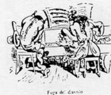
Fuga di: Casini