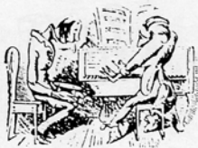
Adagio con sentimento

sestä välttää elokuvaesitysten musiikillista yksitoikkoisuutta. Lisäksi kaikki muusikot eivät tunteneet tarkkojen vihjeluetteloiden kaikkia kappaleita, joten niiden käytössä ilmenneitä hankaluuksia haluttiin välttää väljempää menetelmää noudattaneilla luetteloilla. 14