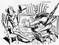
F. G. V. 1842