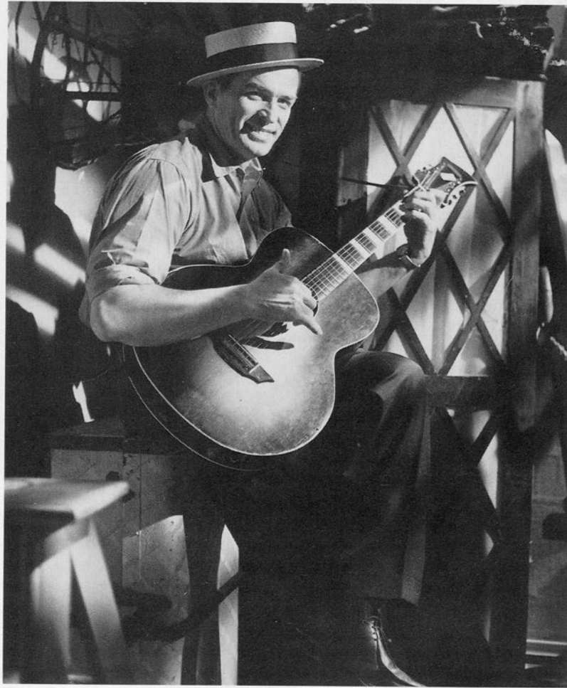
Tapio Rautavaara Suuressa sävelparaatissa.

kvintetti tai sekstetti), solisteinaan esimerkiksi Brita Koivunen ja Vieno Kekkonen. 35 Kaikki nämä miehet tekivät myös elokuvamusiikkia.