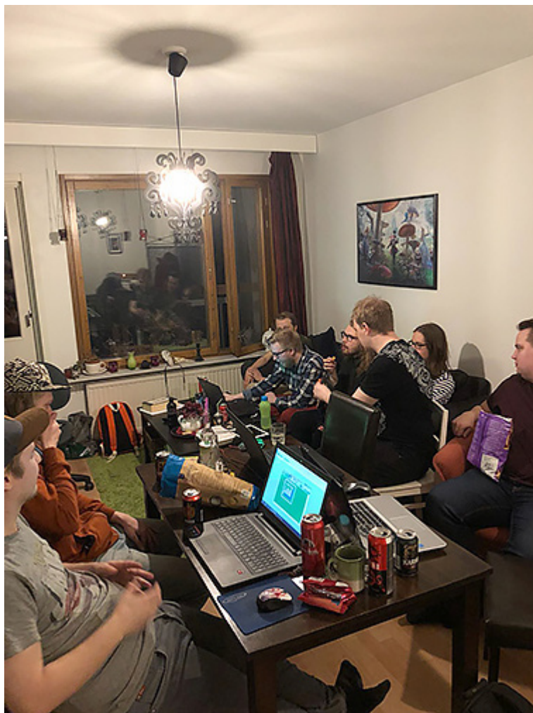
Kuva 2. Tunnelmia Minigolf -laneilta Helsingin Kannelmäestä huhtikuulta 2018.