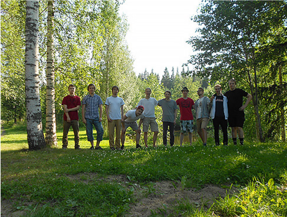
Kuva 1. Yhteiskuva heinäkuussa 2014 Lopella järjestetystä miitistä, joka oli yhteisön ensimmäinen suuri reaali maailman kokoontuminen.

valtaosin miespuolisia, iältään 10–40-vuotiaita. Enemmistö jäsenistä on ollut suomalaisia ja julkiset keskustelut on käyty pääosin suomeksi, mutta jäseniä on ollut jonkin verran myös muualta Euroopasta, etenkin Saksasta. Jäsenistö on vaihtunut vuosien varrella runsaasti, mutta jotkut jäsenet ovat olleet mukana käytännössä koko Aapelin historian ajan. Yhteisö on edelleen vuonna 2019 ollut aktiivinen, vaikka Aapelia ja Minigolfia ei enää olekaan. Yhteisön Discord-kanavalla käydään keskusteluja säännöllisesti, minkä lisäksi osa jäsenistä tapaa toisiaan reaali maailmassa. Esimerkiksi väitöstilaisuuteeni kesäkuussa 2019 osallistui neljä yhteisön jäsentä.