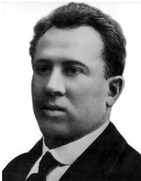
Venäläisen elokuvan uranuurtaja Aleksandr Drankov (1886–1949).

Kesällä 1910 Drankov teki uutiskuvan Viipurin valloituksen 200-vuotisjuhlasta (Višn. 499), johon itse keisarin oli aluksi tarkoitus saapua. Juhlaseremonioiden ja aiheeseen liittyvien Viipuri-kuvien lisäksi elokuvassa nähtiin juhlallisuuksiin osallistuneita venäläisiä ja suomalaisia merkkihenkilöitä. Lehtitiedotteen mukaan filmi oli ”historiallisen merkityksensä lisäksi erityisen ajankohtainen ja kiinnostava siksi, että Venäjän duuma ja valtioneuvosto