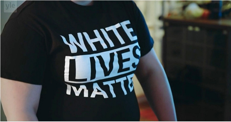
Kuva 1. Ylen dokumenttisarjassa Suomineidot (2022) esitettiin kyseenalaistamatta suomalaisten nationalistien rasisistiakin näkemyksiä. Kuvakaappaus Yle Areenasta.

Deppin ja Heardin välisen oikeudenkäynnin medianäkyvyydellä on sen sijaan juuret sukupuolittuneissa yhteiskuntarakenteissa ja väkivallan esittämisen sukupuolittavissa konventioissa. Oikeudenkäynti oli osa Deppin ja Heardin sotkuista avioeroa, jonka osana kumpikin esitti syytteitä parisuhdeväkivallasta. Keskustelu sekä toisti että haastoi sukupuolittuneita käsityksiä miehistä väkivallantekijöinä ja naisista väkivallan kohteina, koska syytteitä väkivallasta kohdistui suhteen molempiin osapuoliin. (Vrt. Karkulehto & Rossi 2017.) Riippumatta siitä, kumman koettiin rikkoneen puolisoaan vastaan – Deppin vai Heardin – oikeudenkäyntiä ympäröinyt mediasirkus edustaa lähisuhdeväkivallan viihteellistämistä. Julkinen mielipide myös asettui suurilta osin Heardia vastaan, ja hänestä tehdyt halventavat meemit toimivat elävänä esimerkkinä kulttuurisesta naisvihasta.