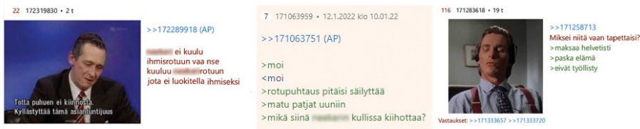
Kuva 4. Epäinhimillistävissä sisällöissä Toisen ihmisarvo kyseenalaistetaan joko kiistämällä eksplisiittisesti tämän ihmisyyden tai viittaamalla tämän ”hyödyttömyyteen” tai ”arvottomuuteen”. Kuvakaappaus.

muotojen rinnalla. Yllä olevissa aineistoesimerkeissä epäinhimillistäminen liittyy niin joukkosurmaan (ks. myös Haslam 2006, 252) kuin myös Toiseen kohdistuvaan fyysiseen väkivaltaan (kuva 4). Nimittämällä Toista geenijätteeksi tai ihmisaastaksi verkkokeskustelija syventää ja legitimoii kuilua itsensä ja Toisen välillä. Väkivallaksi tulkittava ihmisyyden eksplisiittinen kyseenalaistaminen yhdistyy aineistossani myös sisältöihin, joissa Toista kuvaillaan esineenä, kuten ”matupatjana”. Kuvakaappauksessani matupatjoilla viitataan ei-valkoisten maahanmuuttajamiesten kanssa seksisuhteessa oleviin naisiin tai ylipäätään naisiin, joiden nähdään suhtautuvan liian suopeasti maahanmuuttoon. Esineellistävä kuvaaminen on tyypillinen keino varsinkin naisten epäinhimillistämässä, jolloin kohteelta pyritään kieltämään hänen inhimillinen toimijuutensa (Haslam 2006, 253). Matupatja-nimitys on osa pitkäikäistä maahanmuuttovastaista diskurssia, jossa ulkomaalaisten nähdään joko ”vievän” suomalaiset naiset tai kohdistavan heihin seksuaalista väkivaltaa (Sundén & Paasonen 2018, 645). Naisvihamielisyys ja rasismi linkittyvät toisiinsa, kun antirasismia tai feminismiä kannattavat naiset kuvataan monikulttuurisuuden ihannoijina ja siten näennäisen oikeutetusti (seksuaalisen) väkivallan kohteina (Horsti 2016, 1451; Saresma 2017, 234).