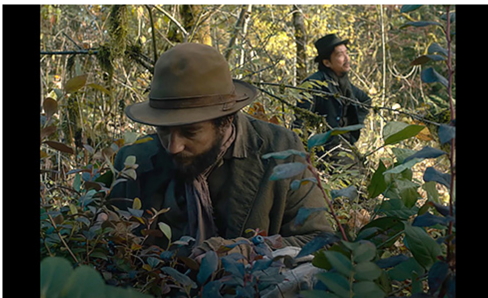
KUVATEKSTI: Kuva 3. Cookie kerää mustikoita kuvan etualalla ja King-Lu pohdiskelee taustalla. Kasvillisuus täyttää muun kuva-alan. Kuvakaappaus Blu-rayltä elokuvasta First Cow .

First Cow keskittyy tunnelman luomiseen ja tapahtumien todistamiseen niiden draamallisen motivoinnin sijaan. Elokuva etenee verkkaisesti ja kasvattaa draaman tuntua hienovaraisesti. Cookie ja King-Lu ikään kuin vain asettuvat elämään toistensa tahtiin, tekevät askareita ja puhuvat haaveistaan. Heitä kuvattaessa rajaukset ovat tiiviitä, mitä korostaa kuvaus analogiselle ajalle