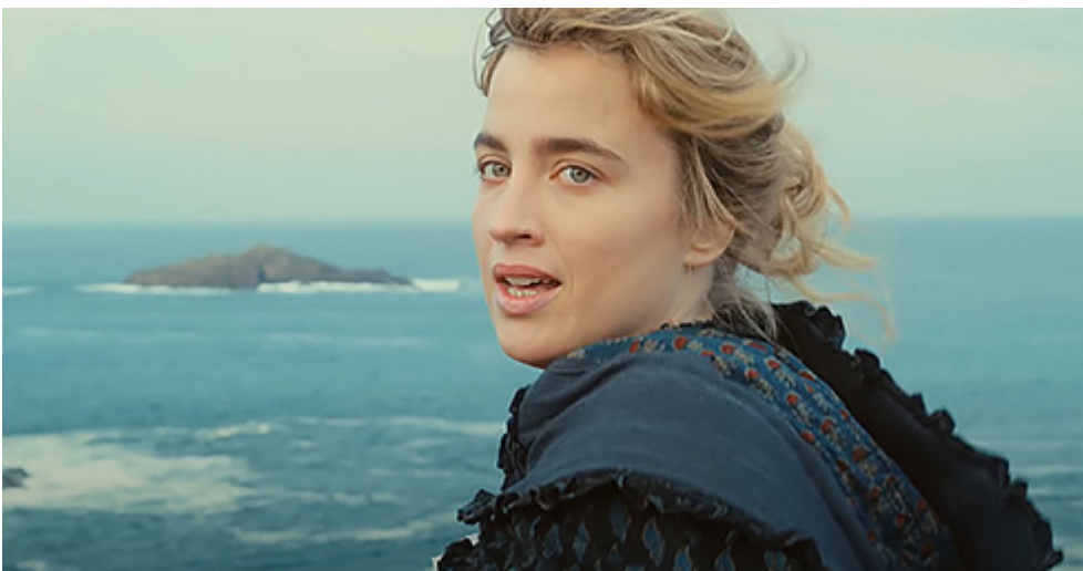
Kuva 1. Héloïsen hahmo yksin kuva-alassa, Mariannen tarkkailun kohteena. Kuva-kaappaus Blu-rayltä elokuvasta Nuoren naisen muotokuva .

Tarinan toinen päähenkilö Héloïse konstruoidaan elokuvan alussa henkilöksi, jolla ei ole vastaavaa toimijuutta. Héloïsen ainoa keino vaikuttaa tilanteeseensa on kieltäytyminen kontaktista, eli mallina istumisesta, mikä ei kuitenkaan estä Marianna tarkkailemasta häntä. Tämä tuottaa perinteisen asetelman naisesta passiivisena katseen kohteena, jonka tehtävä on edistää päähenkilön tarinaa ja tuottaa visuaalista nautintoa. Kameratyö korostaa katsojan ja katsottavan välistä subjektin ja objektin erottelua: näemme Mariannen katselevan Héloïsea etäältä, aina leikkauksen yli eri kuvassa (kuva 1). Elokuvan alkupuolella emme koskaan näe häntä muuten kuin Mariannen katseen kautta. Myös elokuvan ääniraita on Mariannen: ”Korva tulee maalata kokonaan ja rustoa tulee tutkia tarkasti”, hän kuvailee voice-overissa . Ääniraidan käyttö ja kuvauksen puhuttelutavat viittaavat siihen, että Marianne on elokuvan toimija ja voyeuristisen katseen käyttäjä. Koska muusa ja taitelija ovat samaa sukupuolta, asetelma kyseenalaistaa toimijuuden ja ”tirkistelyn” (Mulvey, 1975, 11) miehisyyden. Myös katsojan asemointi tilanteen todista-