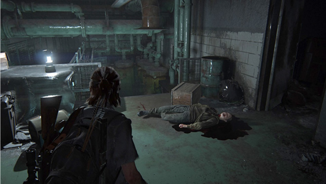
Kuva 2. Ellie tappaa Whitney-nimisen WLF-ryhmän jäsenen toisena päivänään Seattlesa.

taan pelkästään mekaanisesti. Pelaaja ei vain liiku alueelta alueelle ja tyhjennä niitä konemaisesti vihollisista, vaan pelin tarinallinen kehys haastaa pelaajan pohtimaan väkivaltaista toimintaansa pelin sisällä. Epäinhimillistämisen rikkominen voisi estää myös aggression syntymistä, sillä vastustajan inhimillisyyden kiistämisen sijaan peli tuo esille nimenomaan näiden inhimillisyyttä. Seuraavassa osiossa esittelen, miten tämä tapahtuu myös pelimekaanisella tasolla.