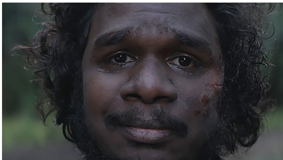
Kuva 4. Lähikuva Claren kasvoista, kun hän murskaa vauvansa tappaneen miehen kasvot. – Kuva 5. Lähikuva Billyn empaattisesta katseesta. Kuvakaappaukset Blu-rayltä elokuvasta The Nightingale .