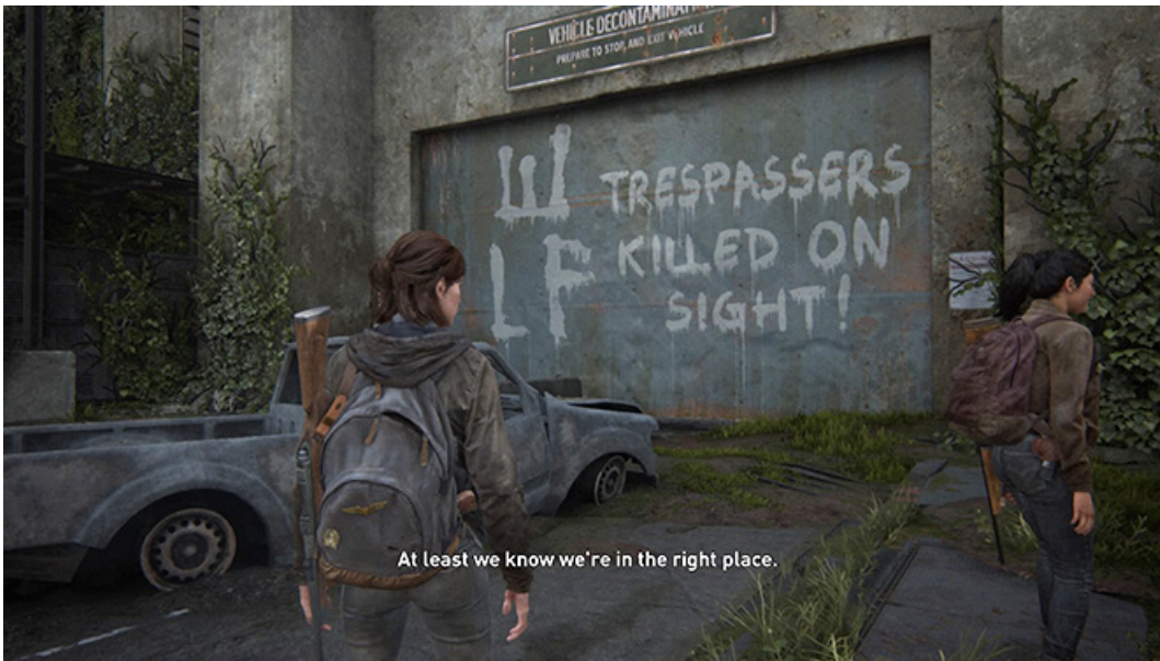
Kuva 1. Seattlen pyrkivien matkalaisten vastaanotto on hyökkäävä, kuten kuvan teksti osoittaa.

Vihollisten raivaaminen pois tieltä Ellien tavoitellessa takaisinmaksua ei näin ollen vaikuta ongelmalliselta pelin kontekstissa.