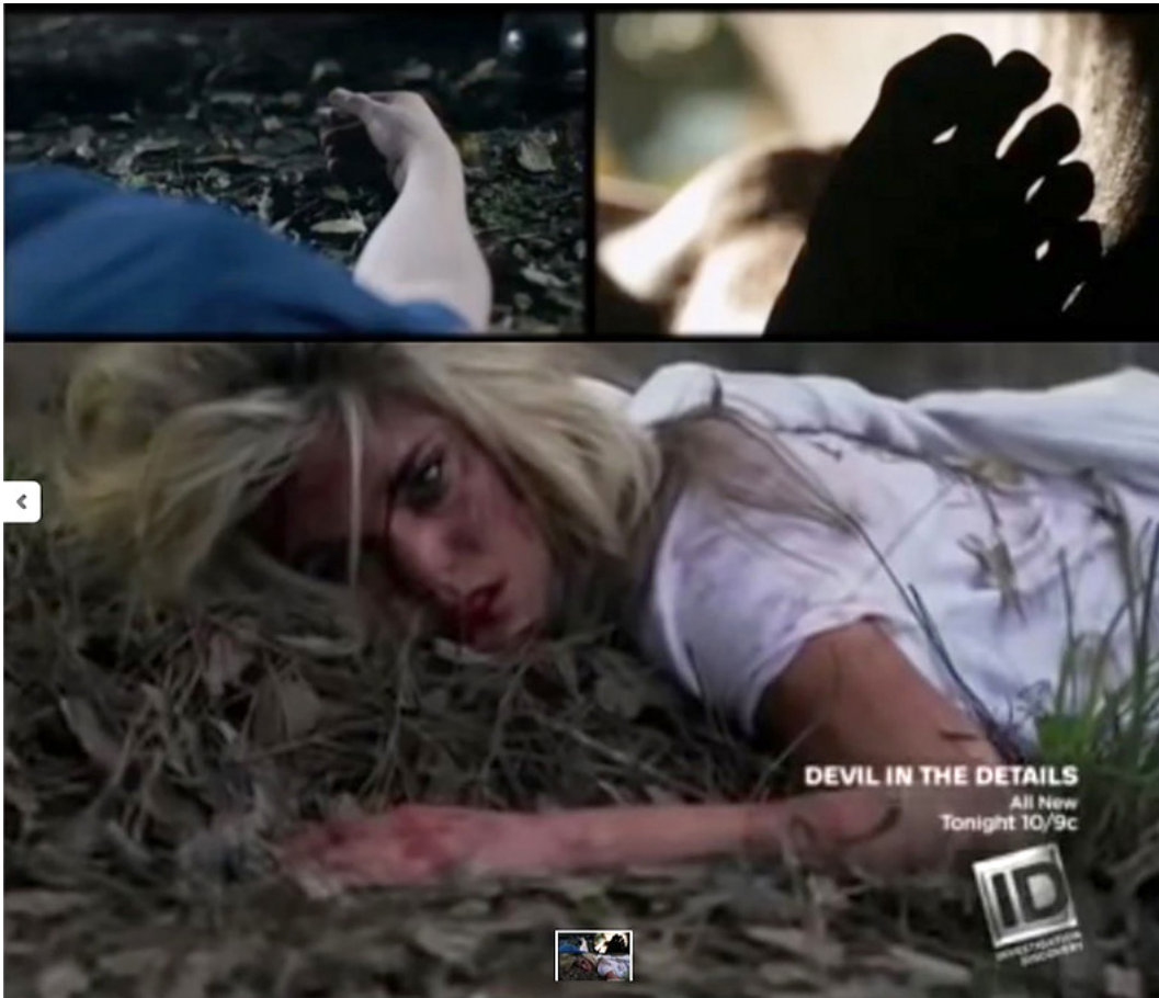
Kuva 1. Erityisesti uudelleen näytellyt true crime -ohjelmat operoivat vahvasti uhrin ja omaisten kärsimyksen korostamisella sekä eksplisiittisellä väkivallan kuvauksella (Tuomi 2018). Kuvakaappausten tiedot: Swamp Murders , kausi 2, jakso 8 "The Chameleon Killer"; Swamp Murders , kausi 4 jakso 16 "Dark water"; Swamp Murders , kausi 2 jakso 10 "Murky Affairs".

erityisesti lähikuvat uhrien kasvoista ovat tärkeässä roolissa: ne kutsuvat katsojaa tuntemaan empatiaa tai todistamaan uhrin tuskaa (Hoffner 2009; Kobach & Weaver 2012). Ohjelmat toteutetaan dokudraamallisesti, ja ne pyrkivät korostamaan, että rikos on tapahtunut oikeasti. Tämä autenttisuuden tuntu saadaan aikaan hyödyntämällä aitoja rikospaikkakuvia tai kuulustelunauhoitteita.