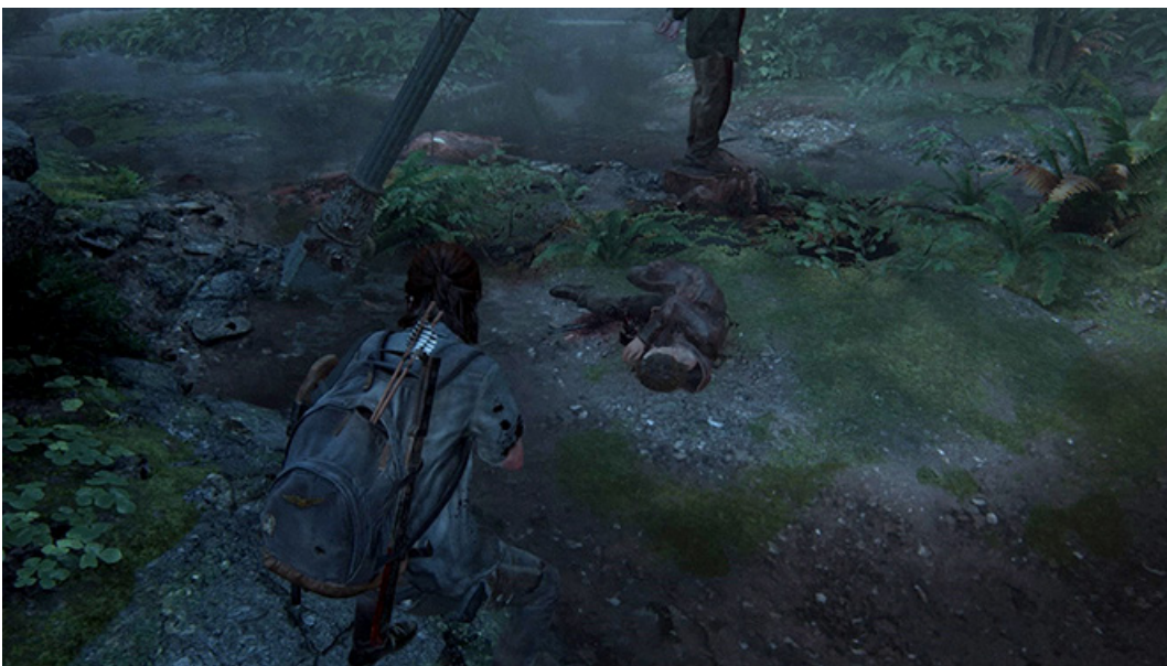
Kuva 4. Seraphite-kultin jäsenen veriseksi tyngäksi silpoutunut käsi. Tuskanhuudot vastustajien raajojen vahingoittuessa ovat kammottavaa kuunneltavaa.

The Last of Us Part II :sta puuttuu yllä mainittu siisteys, ja väkivalta esitetään sen sijaan rumalla ja realistisella tavalla. Vihollisten kehot ja kasvot ovat luotien