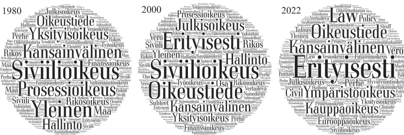
Kuvio 3. Sanapilvet professuurinimikkeistä vuosina 1980, 2000 ja 2022.

Voimme luoda vielä hieman tarkemman katsauksen professuurinimikkeiden kielelliseen muutokseen tutustumalla niistä laatimiimme sanapilviin, jotka esitämme kuviossa 3. 48