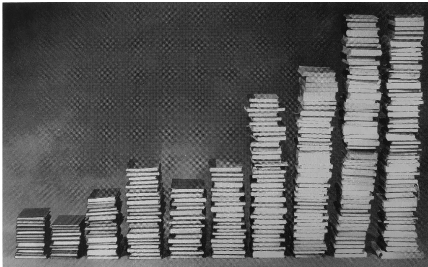
Kuva 1. Urpo Kankaan julkaisema kuva 1900-luvulla julkaistuista oikeustieteellisistä väitöskirjoista pinottuna vuosikymmenittäin. 46