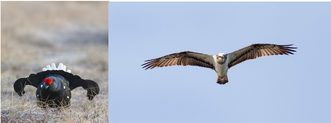
Luonnontilainen Kaakkosuo on teerien jokakeväinen pelipaikka. Kalasääski on ollut suon vakituinen asukas jo vuosikymmeniä.

Keväällä 1958 Brander sai tietää, että uutta Turku–Tampere-valtatietä, ”pikatieä”, oli alettu suunnitella Urjalan kautta, yhtenä linjaus-