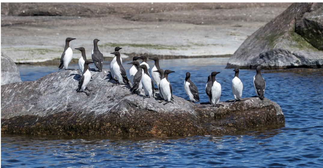
Aspskärin suojelluilla lintusaarilla pesivät maamme suurimmat etelänkiislayhdyskunnat.