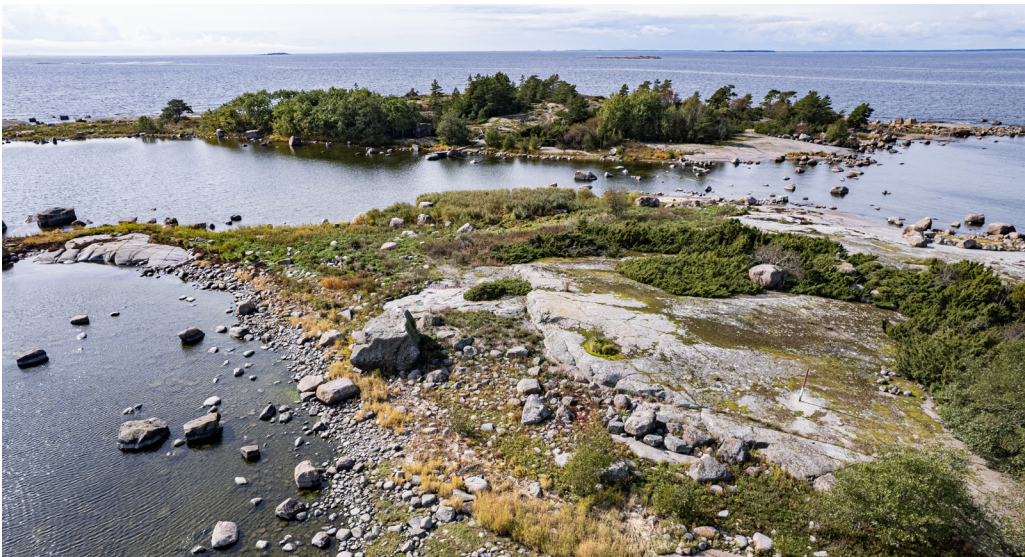
Aspskärin rannat ovat kivikkoisia, avokallioita on vähän. Saarten väliin jää suojaista salmi.