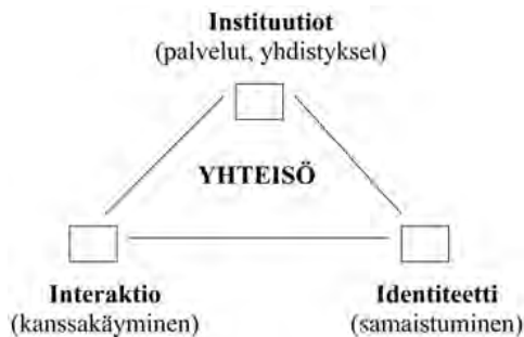
KUVIO 1. Paikallisyhteisön elementit

ta, jolloin se on syntynyt ihmisten välisessä vuorovaikutuksessa ja käytännössä. Symbolinen yhteisyys voi olla myös ideologista, jolloin sen uusintamisesta huolehtivat ideologiset koneistot.