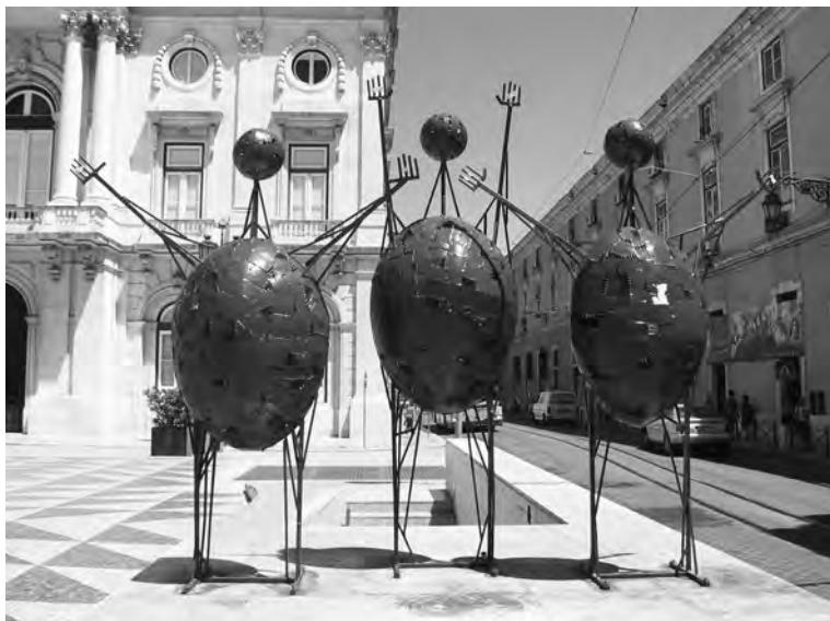
KUVA 1. Kirkkaanpu-naiset, iloiset veijarit tervehtivät Lissabonin kadulla niin tutkijoita kuin muitakin kulkijoita.

Ruokateemojen ohella ja niitä sivuten työryhmissä keskusteltiin esimerkiksi maaseudun kuluttamisesta. Maaseutu kulutuksen kohteena on Euroopassa hyvin suosittu, jopa muodikas näkökulma. Tällöin kiinnitetään huomiota etenkin siihen, että kulutukseen perustuvat toiminnot kuten matkailu, virkistys, ympäristöpalvelut ja kulttuuriset palvelut alkavat ohjata maaseudun kehitystä ja sosiaalista muutosta alati voimakkaammin. Asian käänttöpuolella on tietenkin perinteisen tuotantotoiminnan roolin heikkeneminen. Maailmankonferenssissa kulutustematiikka ei kuitenkaan ollut erityisen laajalti esillä. Consuming the Rural: Food, Nature and Space -työryhmä keräsi suojiinsa parisenkym-