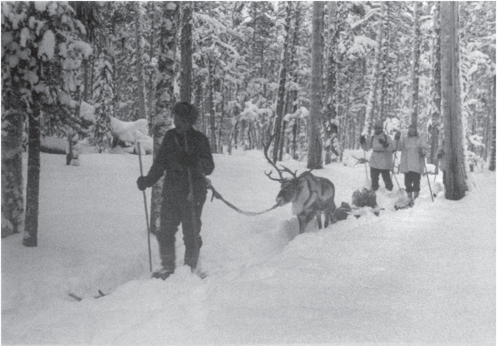
Suomalainen poronhoitaja ja sotilaita lumipuvuissaan helmikuussa 1942.

lisäksi poromiesten oli kyettävä pelastamaan rajan läheisyydessä laiduntaneet porokarjat