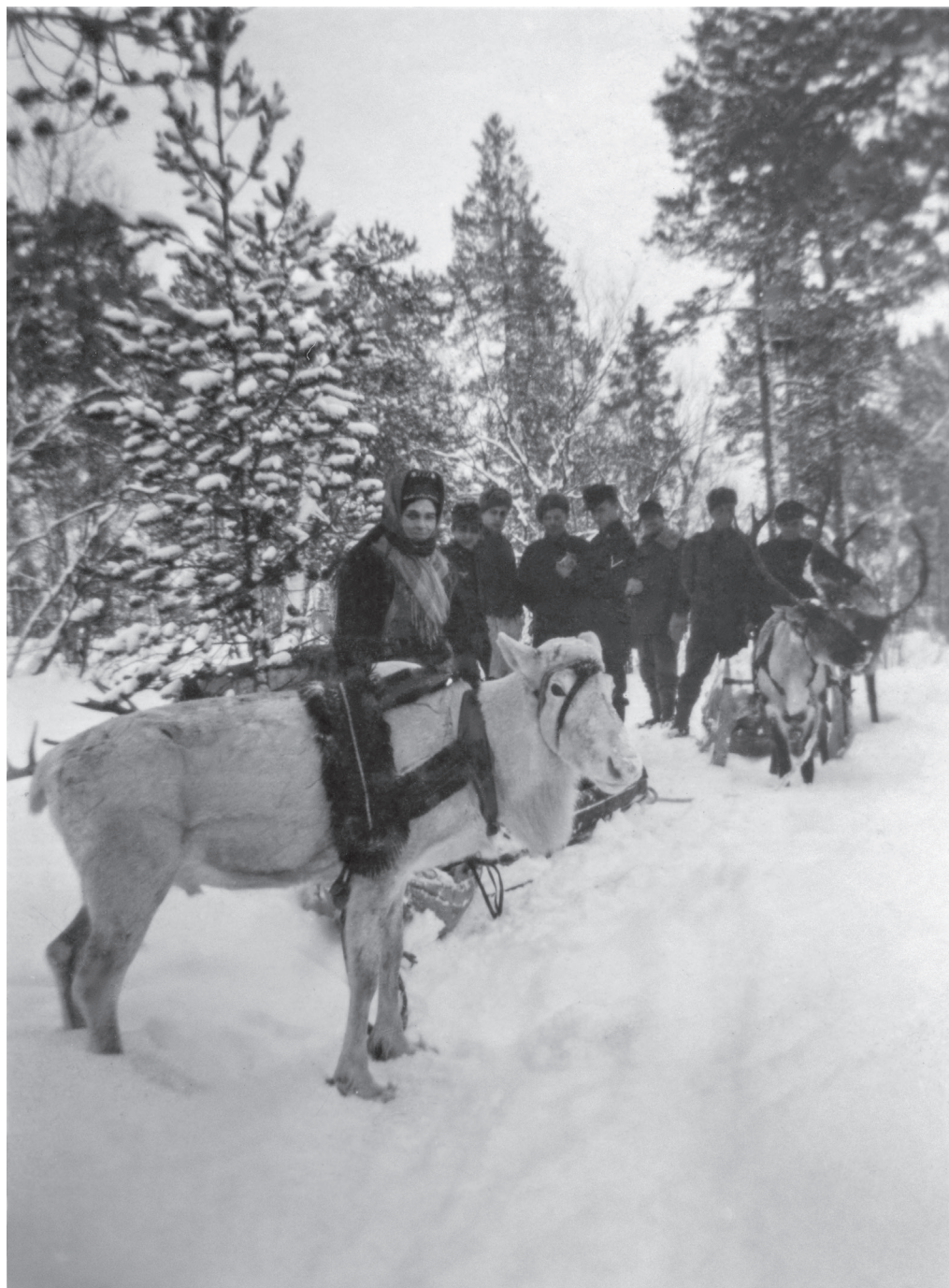
Kolttsaamelainen poroineen ja sotilasjoukko, joista ainakin yksi on saksalainen sotilas jatkosodan aikaan (1941–1944).