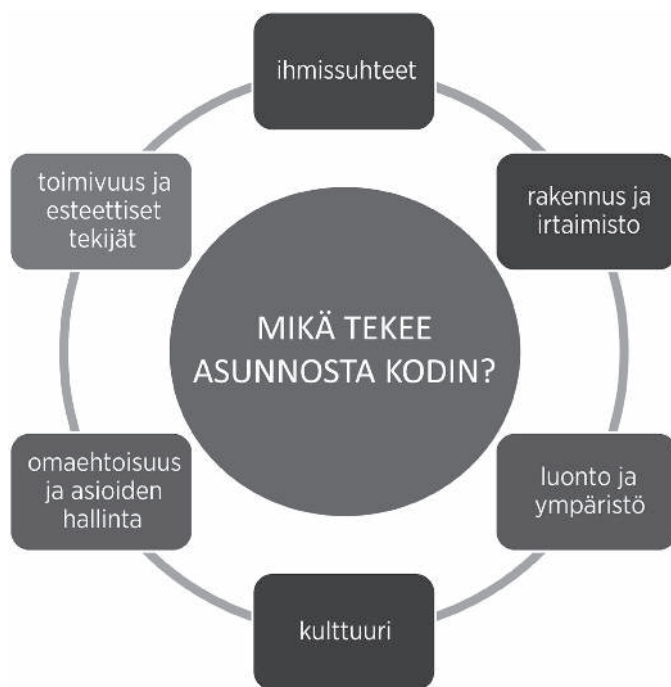
Kuvio 4: Mikä tekee asunnosta kodin?

nin tuloksena saatu kotoisan kodin malli on esitetty kuviossa 4.