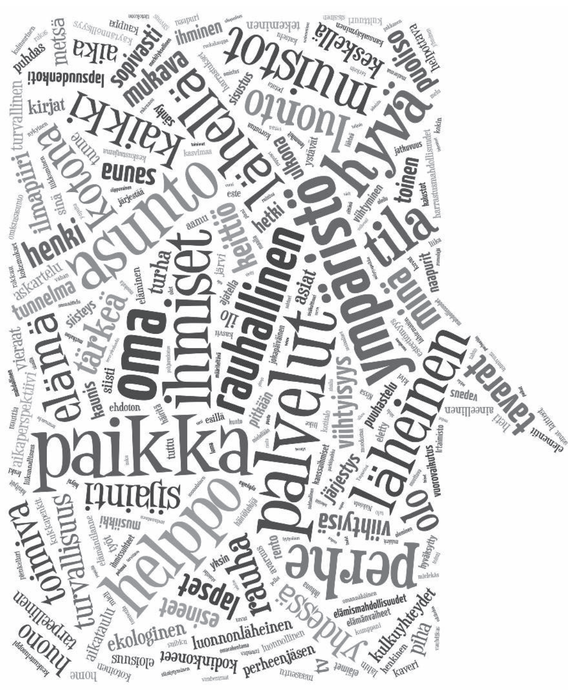
Kuva 1. Sanapilvi: millä sanoilla kodista puhutaan?