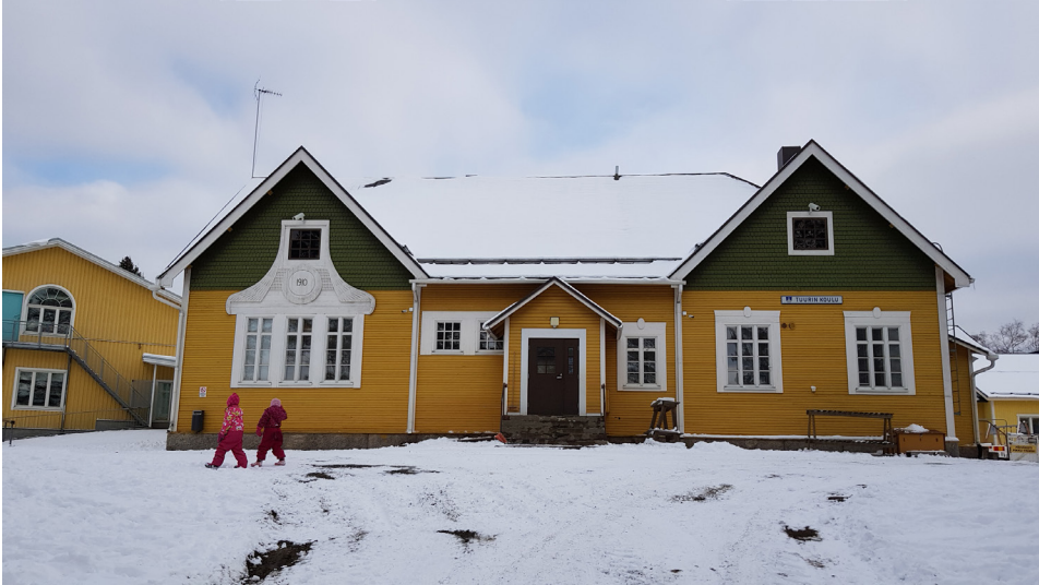
Kuva 2. Jatkuvan muutoksen kylässä koulu edustaa pysyvyyttä, ja vuosiluku naulaa rakennuksen sijaintipaikkaansa ja valmistumisvuoteensa. Se muistuttaa kylän olemassaolosta ennen kauppakylää.

että nyt ei olla Tuurissa, ollaan Töysässä, missä on omat tärkeät paikat ja rakennukset.