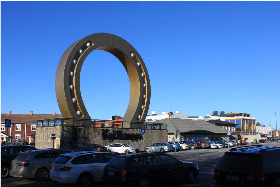
Kuva 1. Seitsenkerroksisen talon korkuinen OnnenKenkä-monumentti vuodelta 2000 on niittänyt mainetta myös groteskiutensa vuoksi. Vuonna 2008 se valittiin kansainvälisessä vertailussa maailman 3. rumimmaksi rakennelmaksi. (Eräheimo 2017, 101.) Koko monumentin takana näkyvä rakennusmassa kuuluu samaan kauppakeskuksen rakennuskokonaisuuteen. Jalustan teksti "Kyläkauppa" muistuttaa kauppakeskuksen juurista.

Koulu on hivenen syrjässä kovimmasta kaupankäynnin vilkseestä. Se on kätkeyty paikkaan, minne matkailijat ja kauppojen asiakkaat harvemmin eksyvät. Koulun edustama Tuuri kuuluu kyläläisille. Koulun seutu muodostaa yhden naapuruston, jossa kylän arkea koetaan. Siksikin se on pysyvyyden kiintopiste kylässä, jossa muutos tuntuu joskus liian nopealta tai suunnaltaan väärältä. Koulu tarjoaa konkreettisen tilan kohdata muistojen kylämaisemaa.