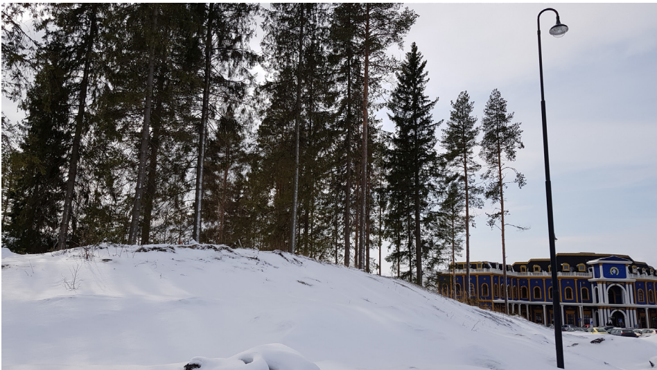
Kuva 3. Keskisen parkkipaikan kohdalla sijainnut Väkkäräpakkana on monissa rakennushankkeissa kutistunut niin, että jäljellä on vain pieniä töyräitä alueen reunoilla. Kyläläiset hämmästelevät, miten niin pienessä kumpareessa ylipäätään sai suksut poikki. Taustalla hämmöttää Keskisen pääsisäänkäynti.

– – aina lähettiin ulos, haettiin toisia – –. Ei se kyllä missään nimes sellasta sisällä nyhjäämistä ollenkaan. Väkkäräpakkalla monet suksut katkottiin – –. Tyttöjä oli vaan siinä Tuurin kylällä niin vähän, et pojanjullien kans mä sitten menin. (Kirkonkylä keskustelu 1.11.2017)