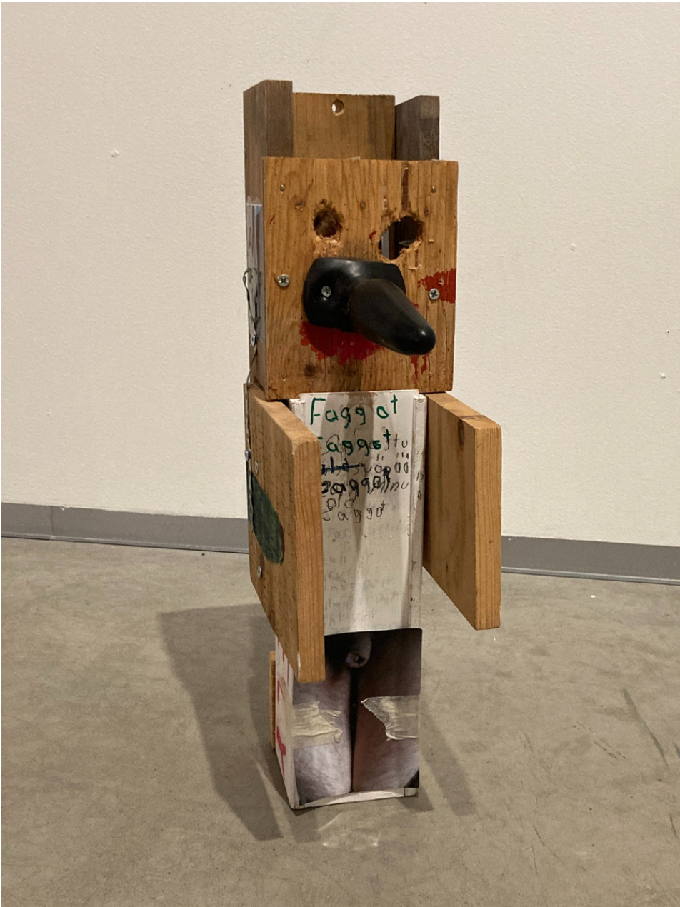
Reima Juhani Hirvonen: faggot-omakuva.