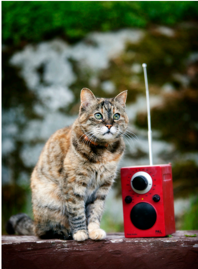
Jaakko Kilpiäinen: Gäddrag 2016.