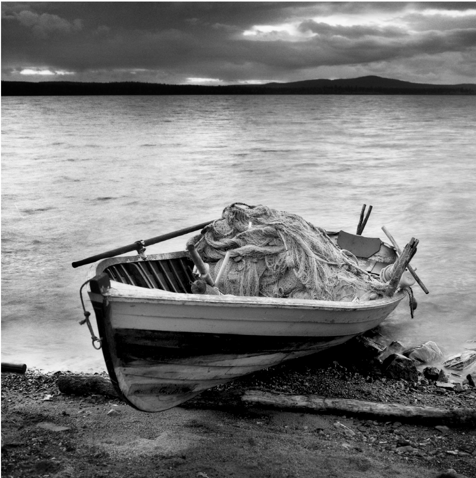
Jaakko Kilpiäinen: Kosto, 1995.