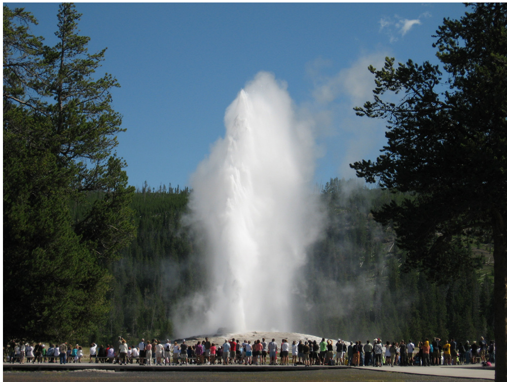
Kuva 2. Old Faithful Geyser, Yellowstone National Park.

Elämänlaatu, puhdas ilma ja vesi, hyvä kylä- tai kaupunkiyhteisö, pääsy julkisille maille, vesiin ja jokiin sekä retkeily- ja virkistysmahdollisuudet – näillä asioilla sekä ihmisiä että yrityksiä (erityisesti teknologiayrityksiä) kannustetaan muuttamaan Montanaan ja vierailemaan siellä. Termeillä ekoturismi tai luontoturismi aluetta ja sen palveluita ei kuitenkaan mainosteta, koska asiakkaat eivät tällaisia palveluita erityisesti etsi.