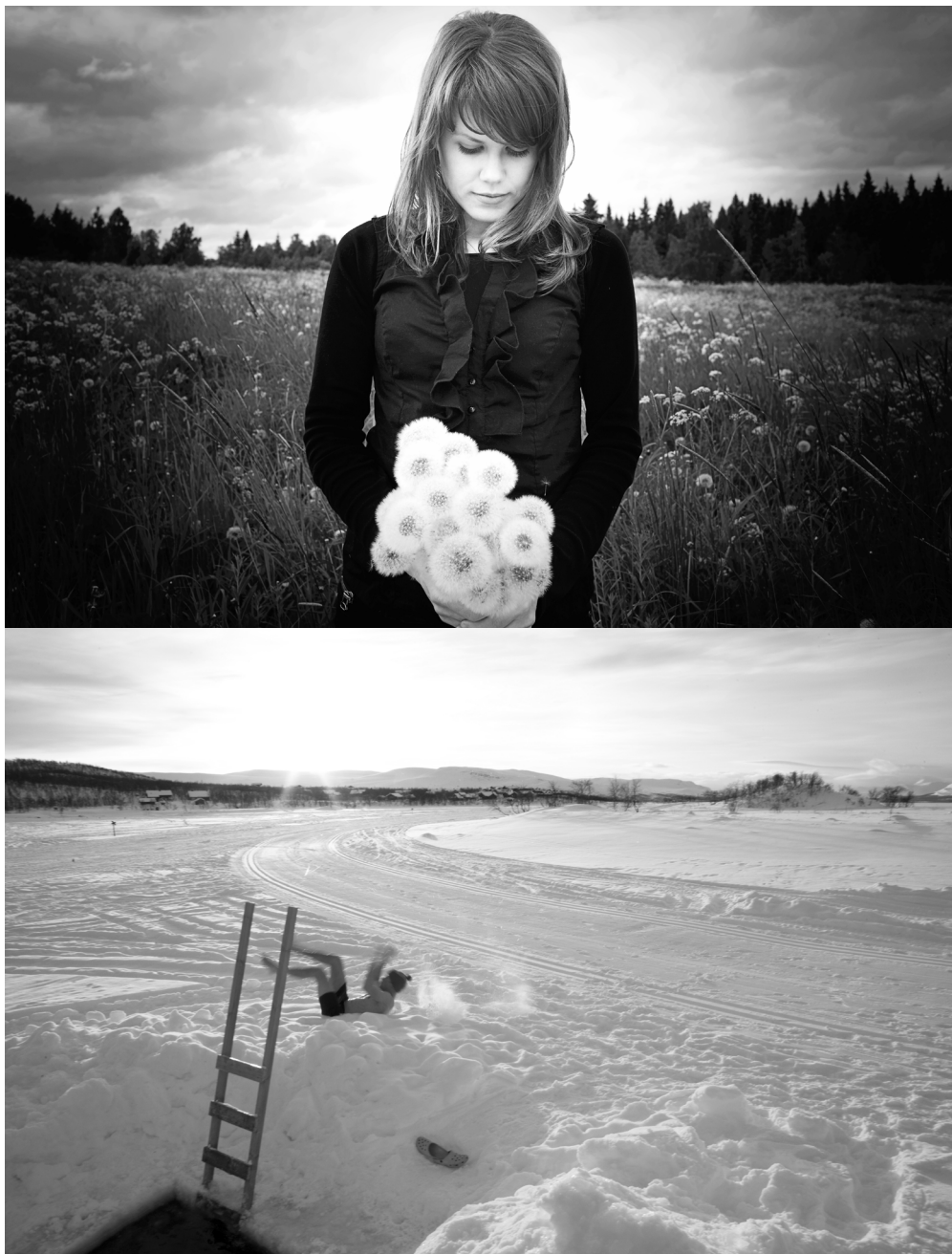
Kuva 1. Esimerkkejä Visit Finland -sivujen kuvarepresentaatioista.

Kokonaiskuvaa hiljaisuuden rakentumisesta Visit Finland -sivustolla rakennetaan tutkimalla hiljaisuuden symbolien ja indeksien toistuvuutta sivuston eri osioissa.