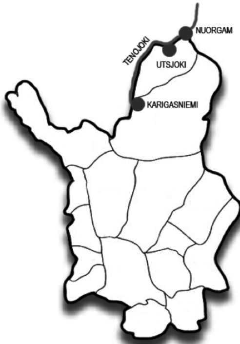
Kuvio 1. Utsjoen, Nuorgamin, Karigasniemen ja Tenojoen sijainti Pohjois-Suomessa.

Utsjoen Kirkonkylän matkailu on hyvin sesonkiluontoista ja vilkkainta kahtena kesäkuukautena. Kirkonkylän matkailu pohjautuu pääsääntöisesti Tenon kalastukseen ja vähäisesti myös syysmetsästykseen, syyskalastukseen ja retkeilyyn. Teno on Suomen suosituin kalastusmatkailukohde lohenkalastajien keskuudessa, koska Utsjoella on luonnonkantainen lohi. Toisaalta myös aito pohjoinen kulttuuri ja maisema houkuttelevat matkailijoita (Soppela, 2009, s. 42). Myös ohikulkijat muodostavat merkittävän matkailijaryhmän, koska he käyttävät alueen matkailupalveluita (esim. kirkkotuvat ja kauppa). Utsjoen matkailun alueellista merkittävyyttä kuvastaa se, että kesämökkien määrä (643) on suurempi kuin asuntokuntien määrä (599) (Tilastokeskus, 2013).