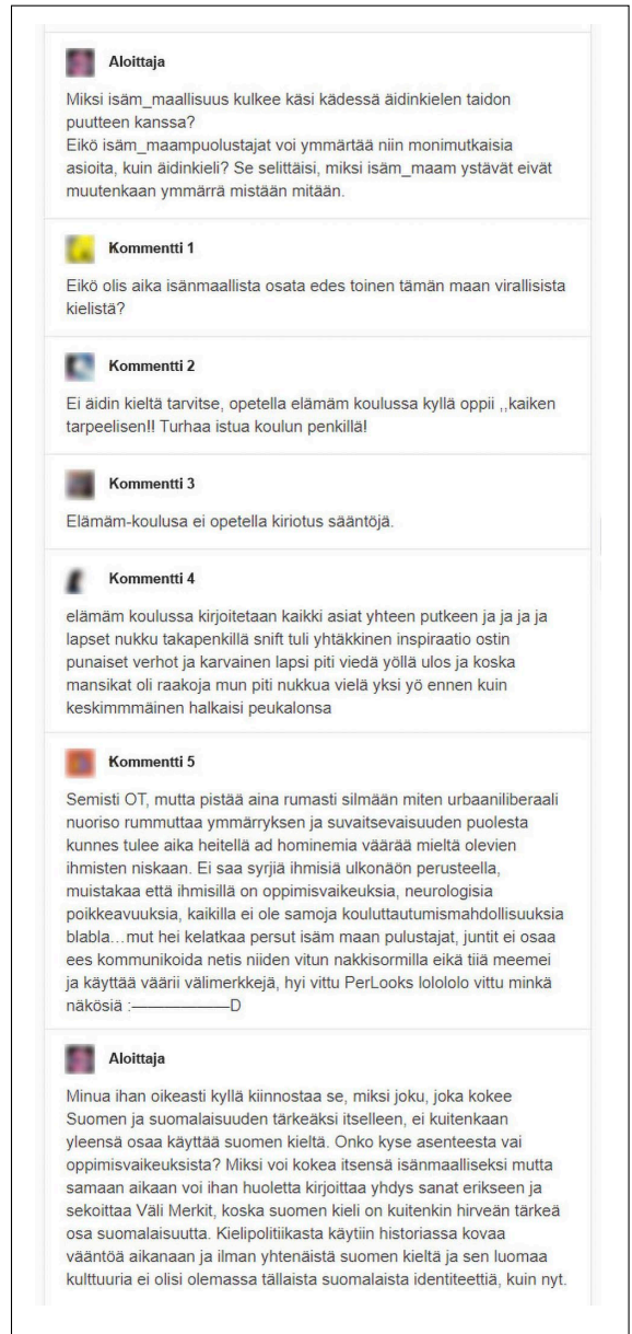
Kuva 2. Keskustelussa toiseksi hahmotetaan erityisesti isänmaallisten ja ”elämäkouluilaiden” kuvitteellisia ihmisryhmiä, mutta toiseuttaminen kohtaa myös vastustusta.

Turhautuminen yhteiskunnassa esiintyvään ahdasmielisyyteen näkyy perinteisistä arvoista kiinnipitäviin kohdistuvassa toiseuttamisessa. Sen lisäksi, että aineistossa esiintyvä toiseuttaminen kohdistuu jaettujen arvojen perusteella, se kohdistuu myös valta- ja auktoriteettiaseman perusteella . Suomenkielisen Tumblrin sisällöissä epäily auktoriteetteja kohtaan yhdistyy myös käyttäjien nuoreen ikään: toiseuttaminen kohdistuu usein henkilöön, joka on auktoriteettiasemassa oleva aikuinen kuten opettaja, vanhempi, lääkäri, poliitikko tai muu viranhaltija. Vaikka jaetuissa kokemuksissa oma elämä hahmotettaisiin vähintäänkin aikuisuuden kynnyksellä olevaksi, auktoriteettiasemassa olevat aikuiset voidaan nähdä eräänlaisina aikuisuuden portinvartijoina tai erilaista, kontrolloitua aikuisuutta elävinä. Kokemus alemmuudesta ja toisaalta auktoriteetteihin liittyvä turhautuminen näkyvät keskusteluissa usein rintarinnan, kuten alla olevassa hallituksen politiikkaa ja työttömyyttä käsittelevässä Tumblr-päivityksessä (ks. kuva 3). Tällaiset rinnakkain rakentuvat erilaisen toiseuttamisen muodot ovat myös osoitus siitä, että toiseuttamisessa on kyse sekä oman itsen että toisen määrittelystä, eivätkä nämä kaksi määrittelyn tavoitetta aina ole täysin erotettavissa toisistaan.