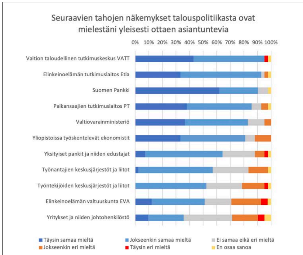
Kuvio 2. Toimittajien näkemyksiä talouspoliittisen asiantuntijoiden ja keskustelijoiden asiantuntemuksesta.

Erilaisten talousasiantuntijoiden asiantuntemusta arvioidessaan toimittajat kertovat pitävänsä erityisesti tutkimuslaitoksia ja valtionhallinnon instituutioita asiantuntevina talouspoliittisina keskustelijoina (ks. kuvio 2). Yli 60 prosenttia vastaajista on täysin samaa mieltä siitä, että Suomen Pankin näkemykset talouspolitiikasta ovat yleisesti ottaen asiantuntevia. Toimittajat arvostavat myös Valtion taloudellisen tutkimuskeskuksen VATTin, Elinkeinoelämän tutkimuslaitoksen Etlan, Palkansaajien tutkimuslaitoksen PT:n sekä valtiovarainministeriön asiantuntemusta. Toimittajat pitävät myös yliopistoissa työskenteleviä ekonomisteja asiantuntevina keskustelijoina. Yllä mainittujen organisaatioiden kohdalla yli 80 prosenttia vastaajista on vähintään jokseenkin samaa mieltä sen väitteen kanssa, että niiden esittämät näkemykset talouspolitiikasta ovat asiantuntevia.